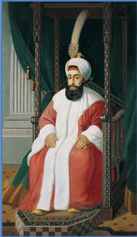
Султан Селим III. Посмертный портрет 1850 года

Селим III -султан Османской империи (1789—1807), сын султана Мустафы III. Пытался модернизировать страну, опираясь на европейские примеры, проводил либеральные реформы, ограничил вольности и привилегии корпуса янычар. Увлекался светским искусством и поэзией. Был свергнут янычарами. Во время бунта, приведшего к свержению Мустафы IV, Селим был убит по приказу султана.