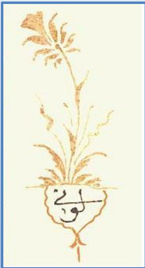
Миниатюра, изображающая тюльпан