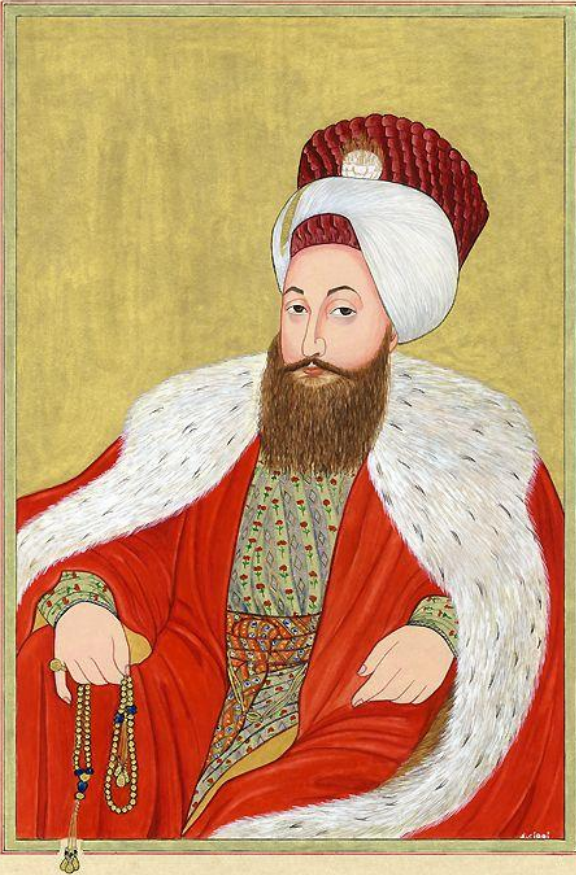
Султан Селим III

1. Издал указ об изъятии земельных владений у лиц, уклоняющихся от военной службы и обеспечения армии султана солдатами