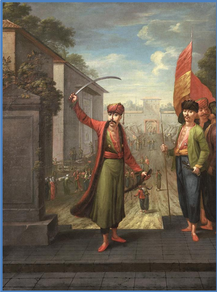
Портрет Патрона Халила кисти Жана-Батиста ван Мура.

Эпоха тюльпанов требовала огромных затрат, вследствие этого постоянно повышались налоги и цены. Среди ремесленников и торговцев возникло недовольство, перешедшее в бунт. К рядам недовольных примкнули и янычары, которых не радовала обстановка в начавшейся в 1730 году войне против персов. Произвол властей лишь накалял обстановку. Бунт вылился в восстание, возглавляемое албанцем Халилом. Великий визирь был свергнут и убит; султан Ахмед III низложен; введённые ими налоги и пошлины были отменены. Восстание Патрона Халила положило конец Эпохе тюльпанов.