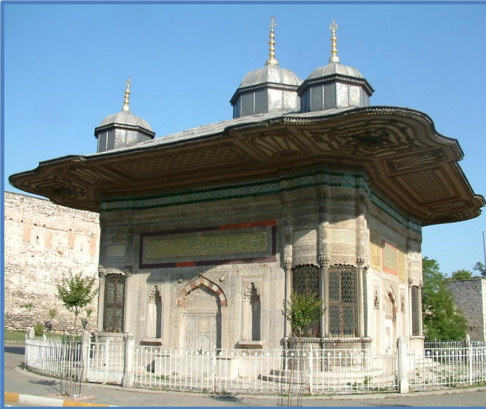
Фонтан Ахмеда III — классический пример архитектуры эпохи тюльпанов