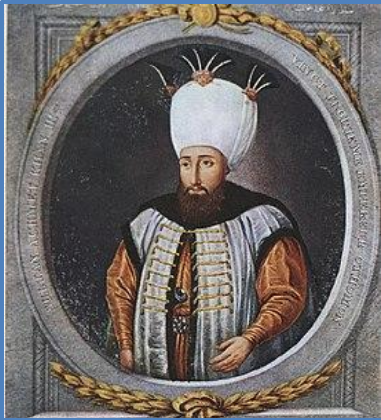
Султан Ахмед III

Правительство Ахмеда III приняло меры по преодолению становившегося все более очевидным отставания Османской империи от европейских держав: