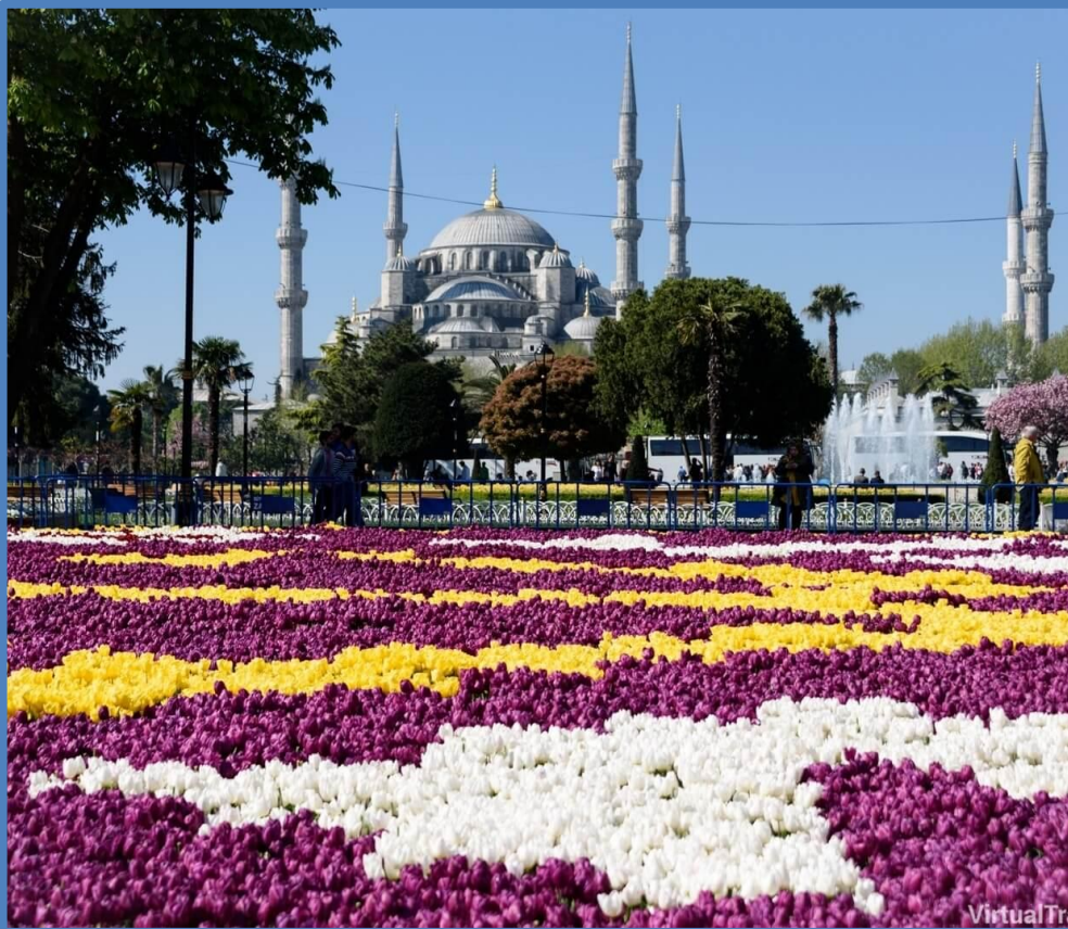
Праздник тюльпанов в Турции