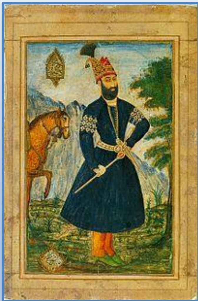
Бахрам. Портрет Надир Шаха