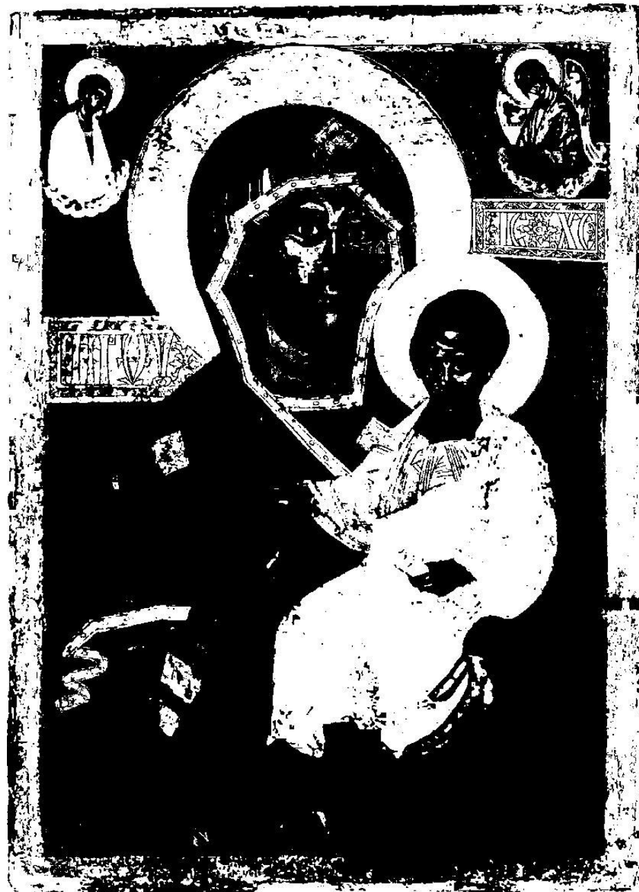
«Богоматерь Одигитрия Смоленская». XVI в.