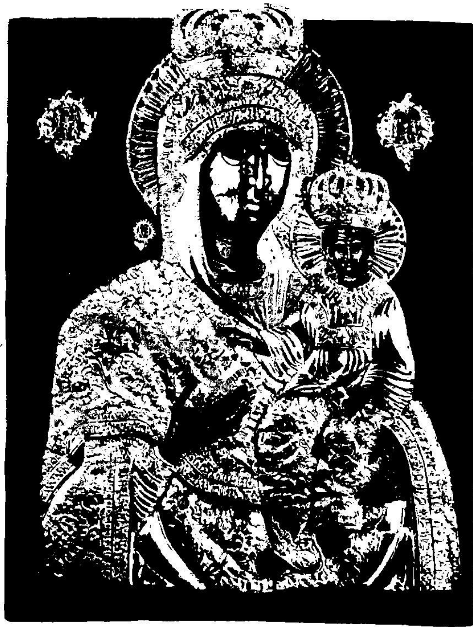
«Богоматерь Одигитрия Смоленская». XVI в.