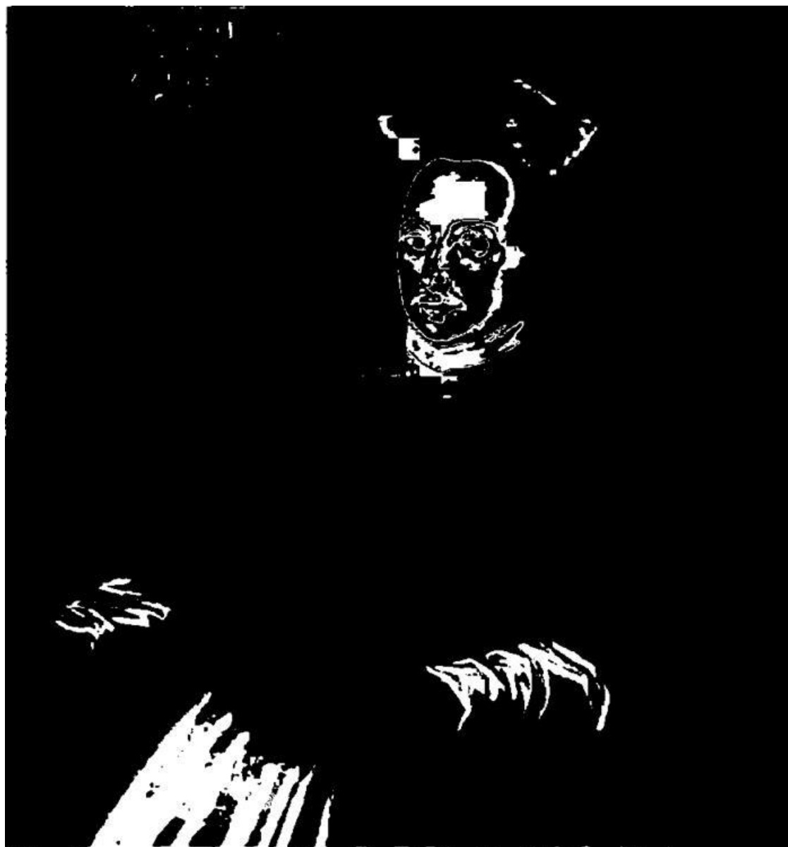
Портрет Юрия (Ежи) Радзивилла. 1590-ые гг.