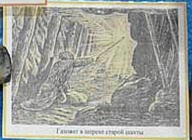
Газовый жет в трещине старой шахты