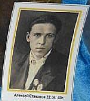
Алексей Стаханов 22.04. 40г.