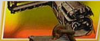
В 1958-60 годах в шахтах Донбасса использовались лампы «Горняк» и «Горняк-М».

В Донбасском угольном бассейне общее количество пластов и прослоев в нижнем отделе каменноугольной системы около 100, в верхнем — 15. Преобладающая часть рабочих пластов имеет мощность от 0,6 м до 1,0 м. Распространены все основные марки каменных углей: длиннопламенные (Д), газовые (Г), жирные (Ж), коксовые (К), отощенные спекающиеся (ОС), тощие (Т), полуантрациты (ПА) и антрациты (А), а также переходные от бурых углей к длиннопламенным.