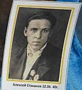
Алексей Стаханов 22.04. 40г.