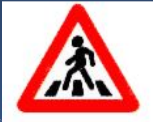
Знак, предупреждающий о наличии пешеходного перехода