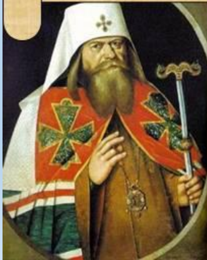
Патриарх Анриан (копия с парсуны XVII века)

Эта реформа окончательно превратила церковь в опору российского абсолютизма.