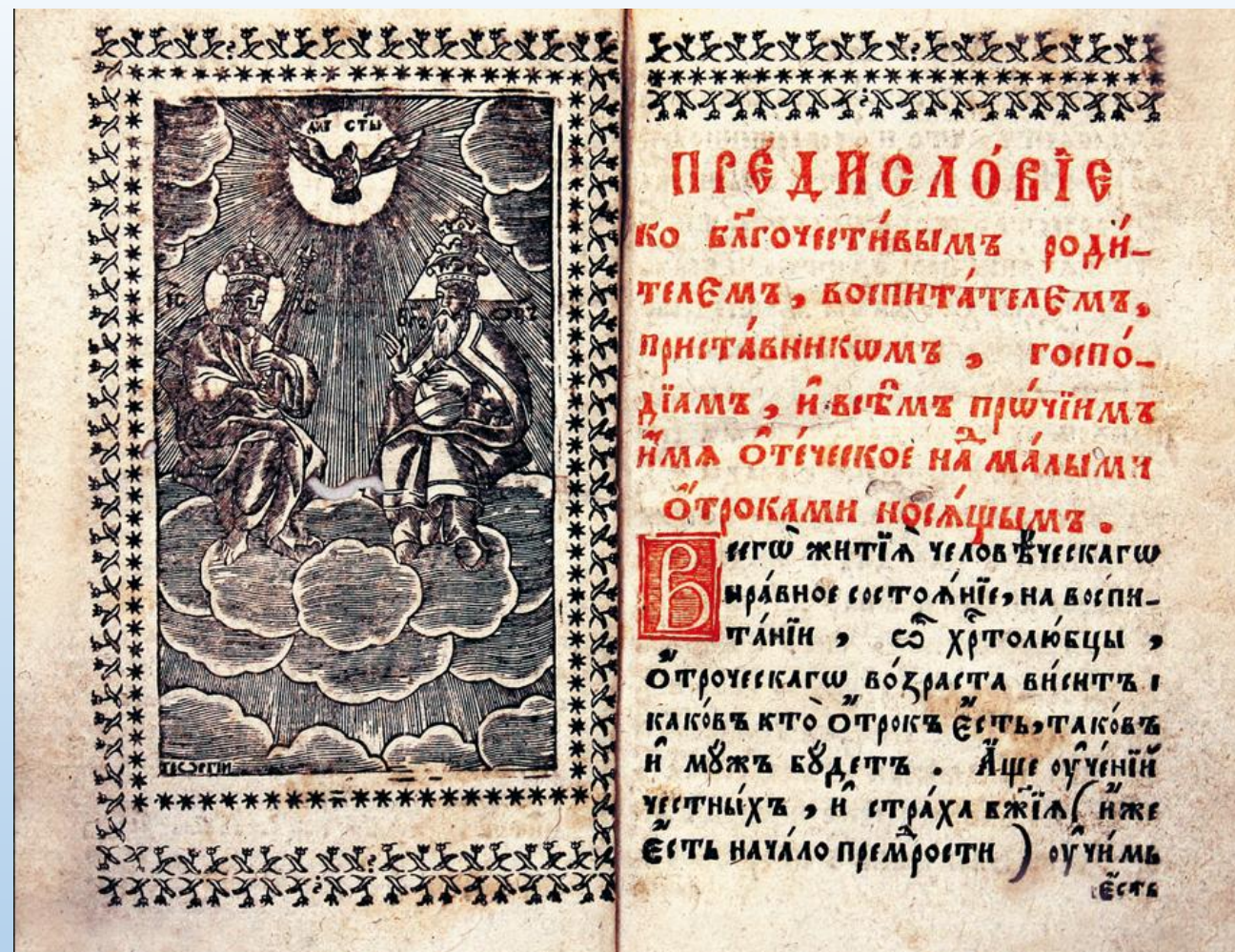
«Первое учение отрокам» Ф. Прокоповича

Для школ были созданы новые учебники: «Букварь» Ф. Поликарпова, «Арифметика» Л. Магницкого, «Первое учение отрокам» Ф. Прокоповича.