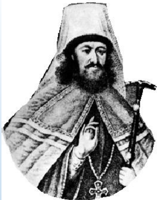
Стефан Яворский – местоблюститель с 1700 г.