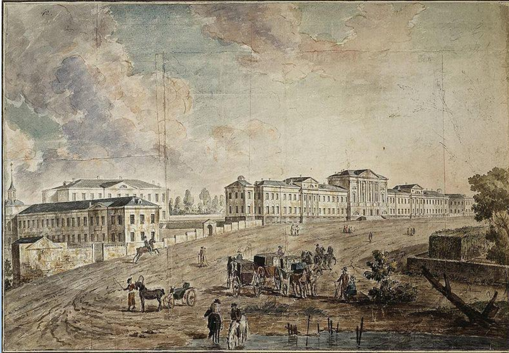
Военный госпиталь в Лефортово. Художник Алексеев Ф. Я.

Госпиталь существует по сей день, сейчас он называется «Главный военный клинический госпиталь имени академика Н. Н. Бурденко».