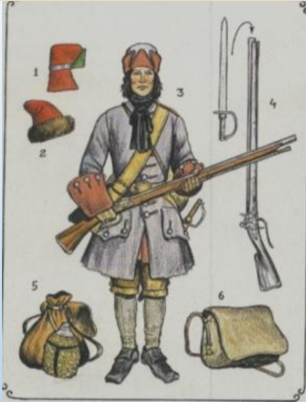
Рекрут петровской эпохи. Сермяжный кафтан, ружье с багинетом, картуз и стрелецкая шапка, ранцы разных видов.

Пётр изменил принципы комплектования вооруженных сил. Вместо набора добровольцев (вольницы) армия стала комплектоваться на основе рекрутской системы.