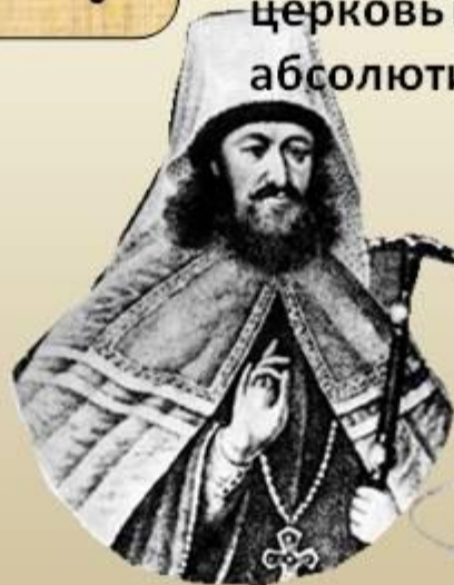
Стефан Яворский - местоблюститель с 1700 г.