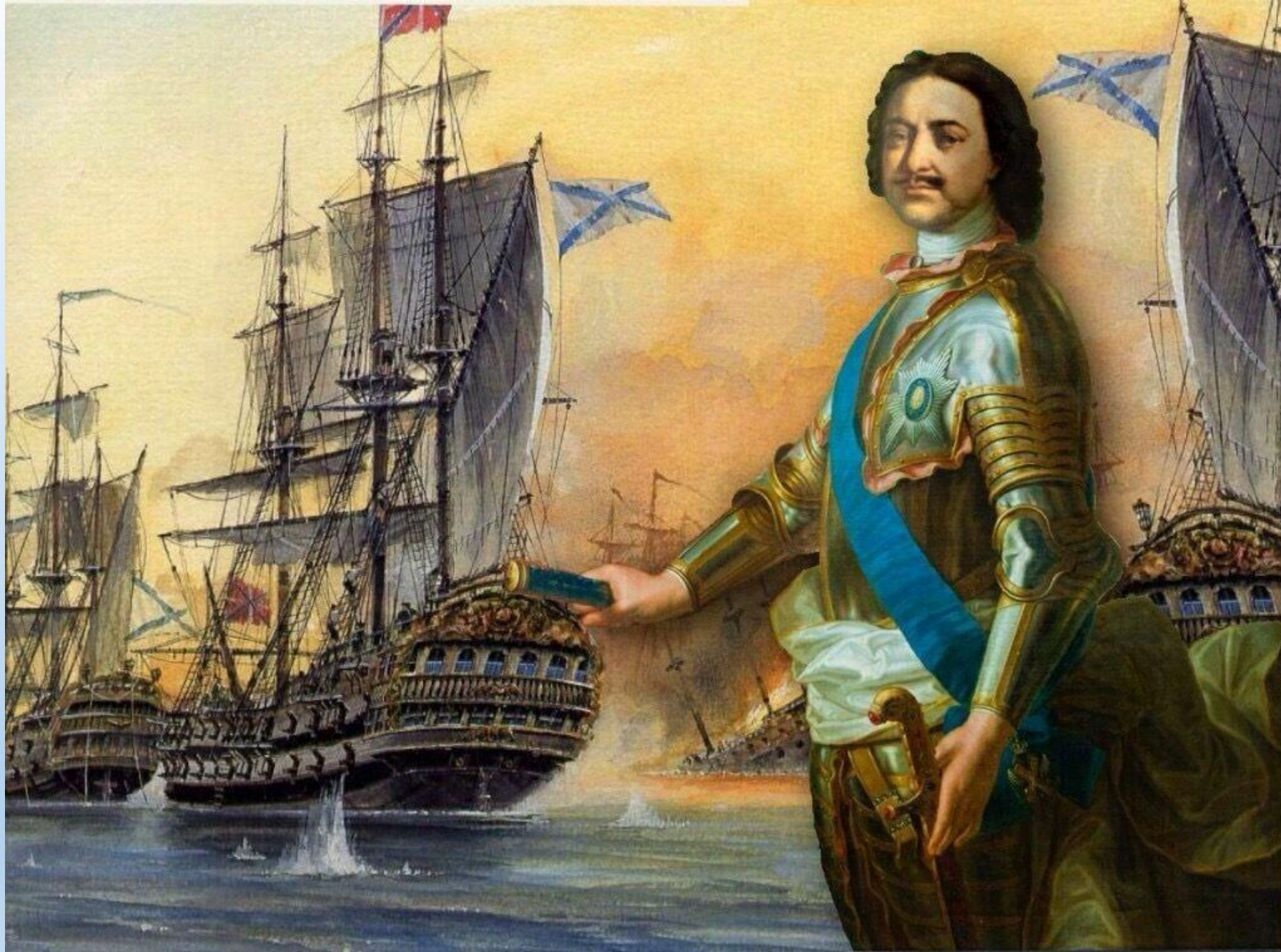
Армия и флот были основной заботой Петра I