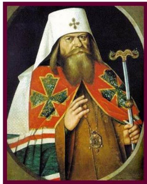
Патриарх Андриан (копия с парсуны XVII века)