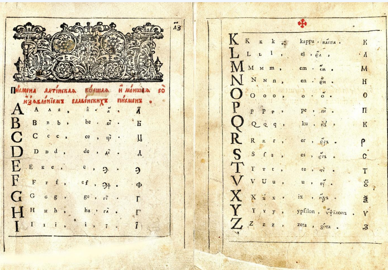
«Букварь» Ф. Поликарпова