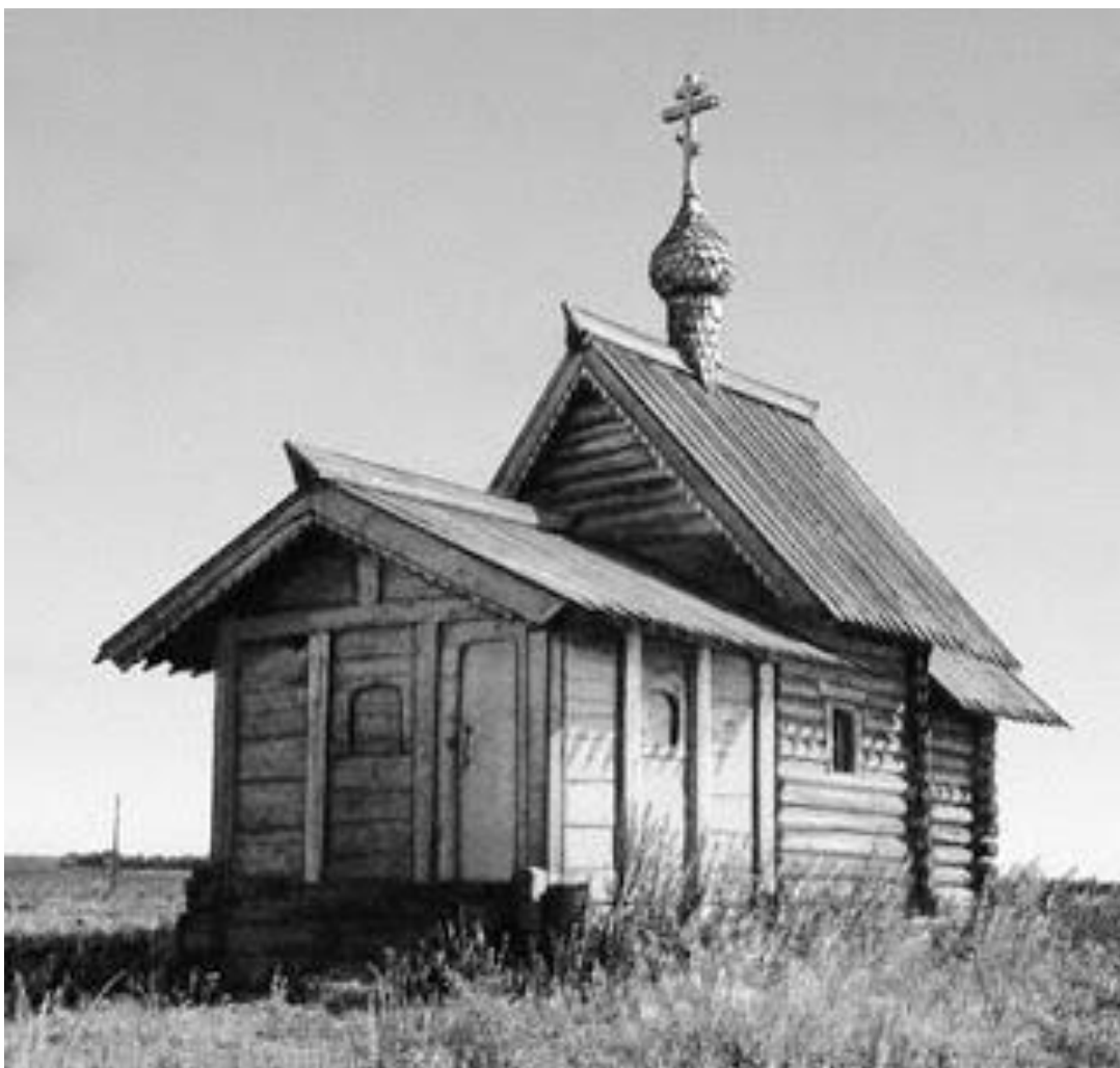
Лазаревская церковь Муромского монастыря