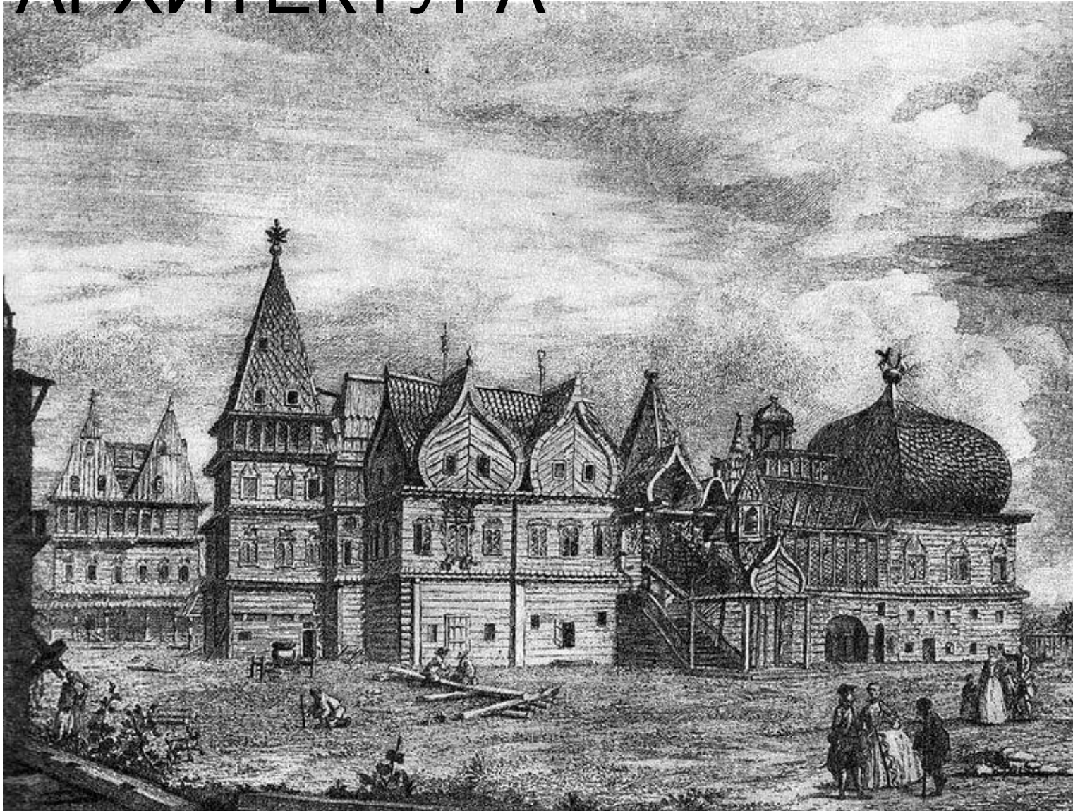
царский дворец в селе Коломенском - первоначальный вид