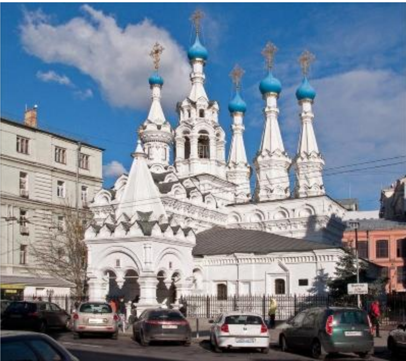
церковь Рождества Богородицы в Путинках