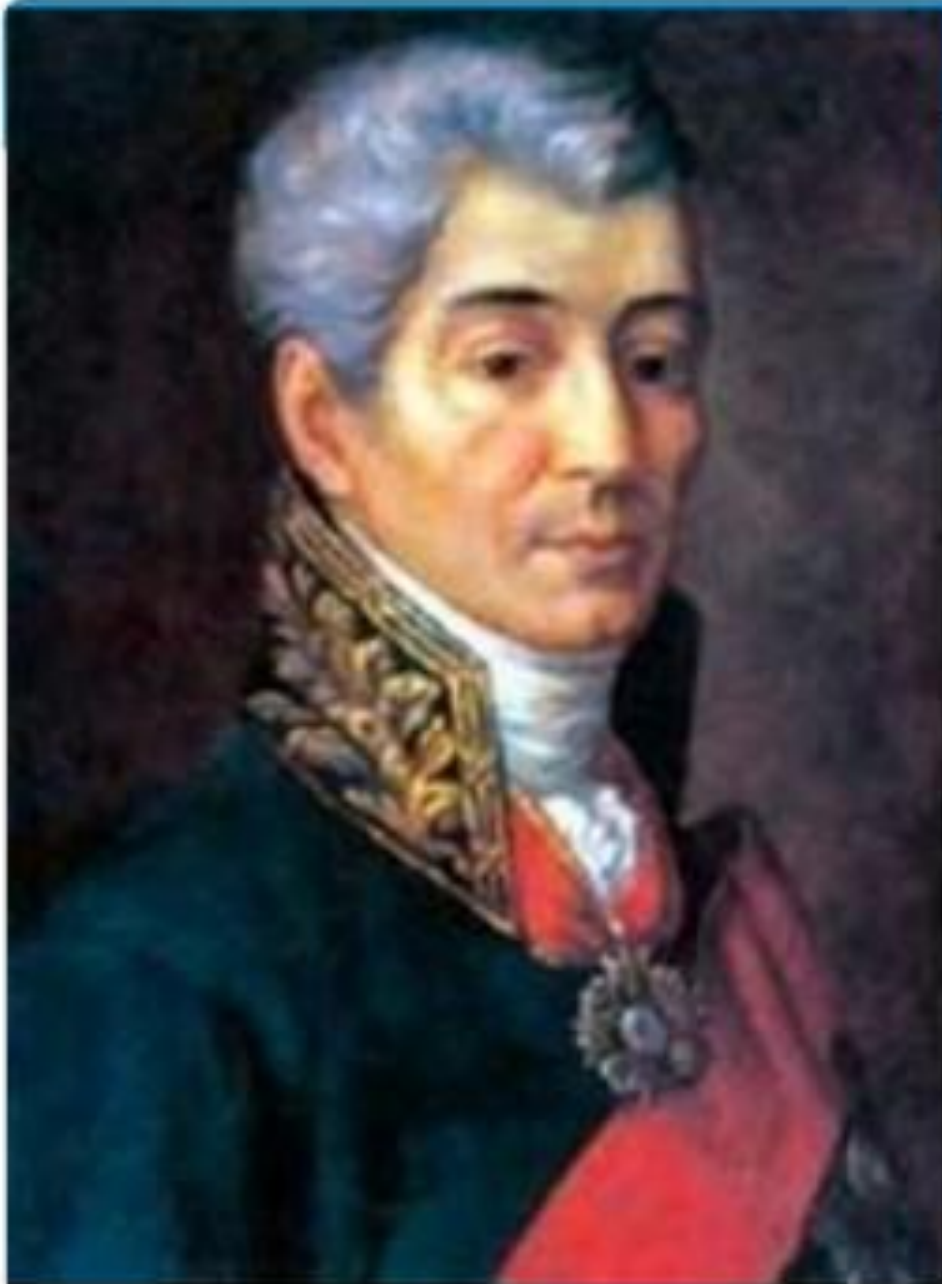
Иван Иванович Дмитриев (1760 – 1837)