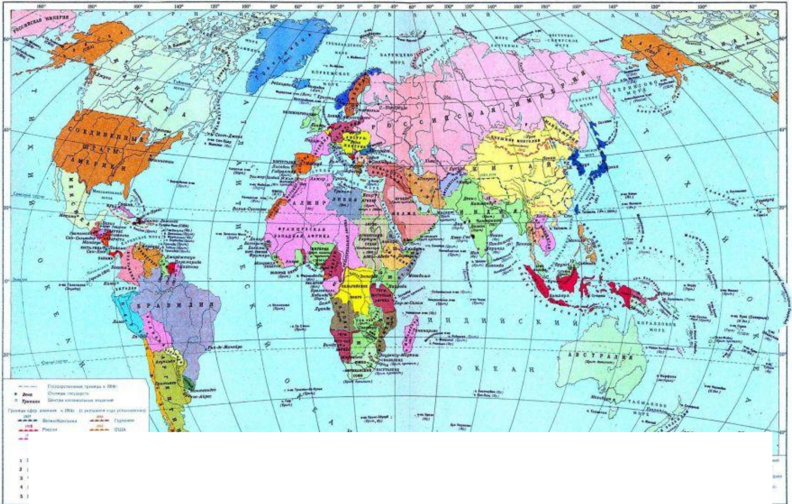
ПОЛИТИЧЕСКАЯ КАРТА МИРА НАКАНУНЕ ПЕРВОЙ МИРОВОЙ ВОЙНЫ