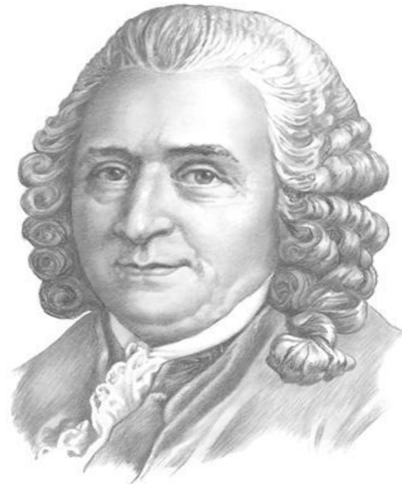
Карл Линней 1707—1778