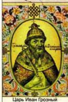
Царь Иван Грозный