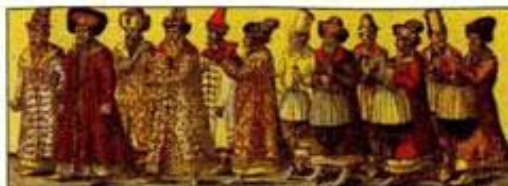
Русское посольство к германскому императору