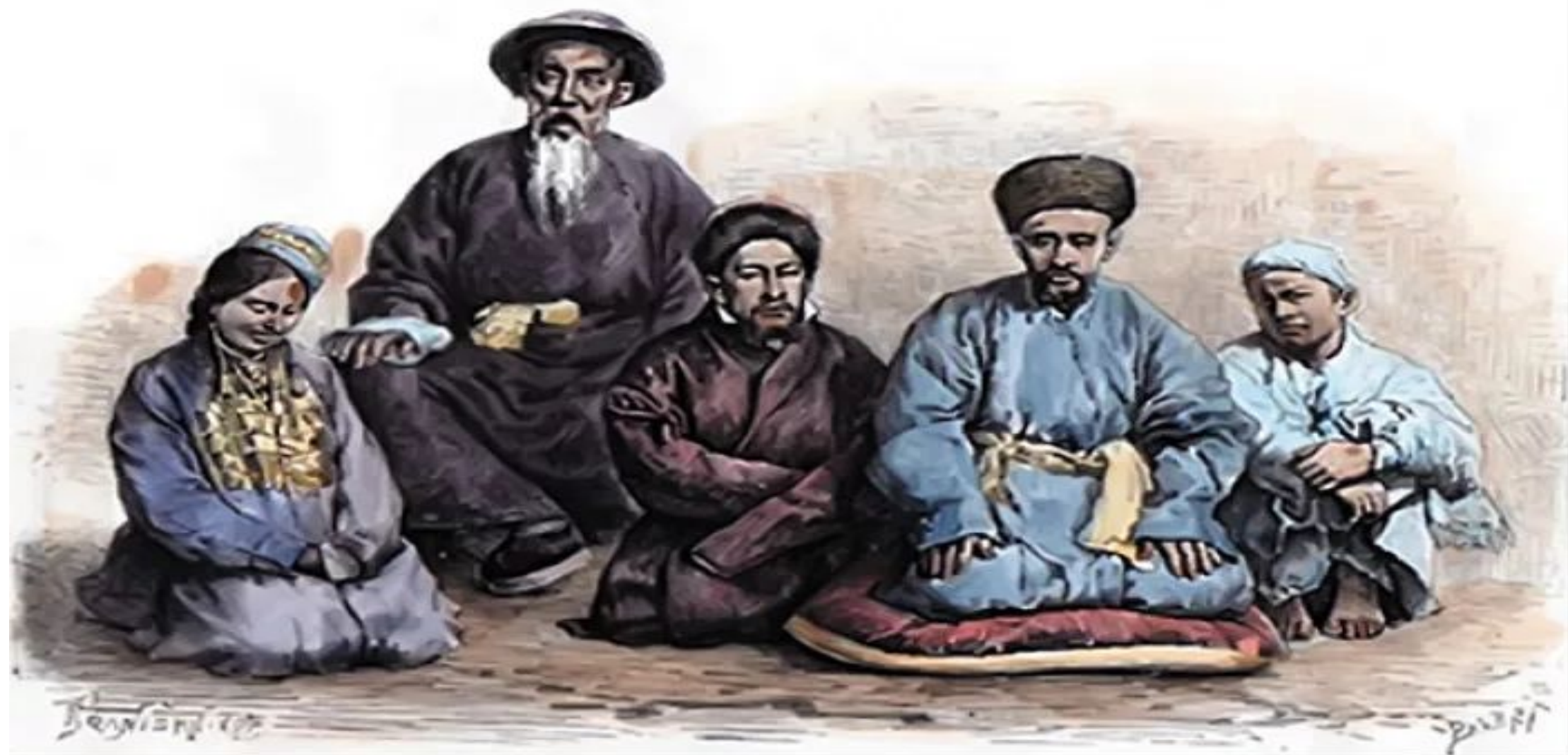
Дунганы и таранчи в традиционных костюмах. Иллюстрация к труду Жака Элизе Реклю «Земля и люди». 1873—1893 гг.