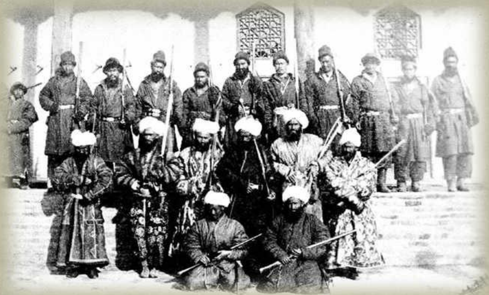
Воины Якуб-бека, фото 70-х годов XIX века