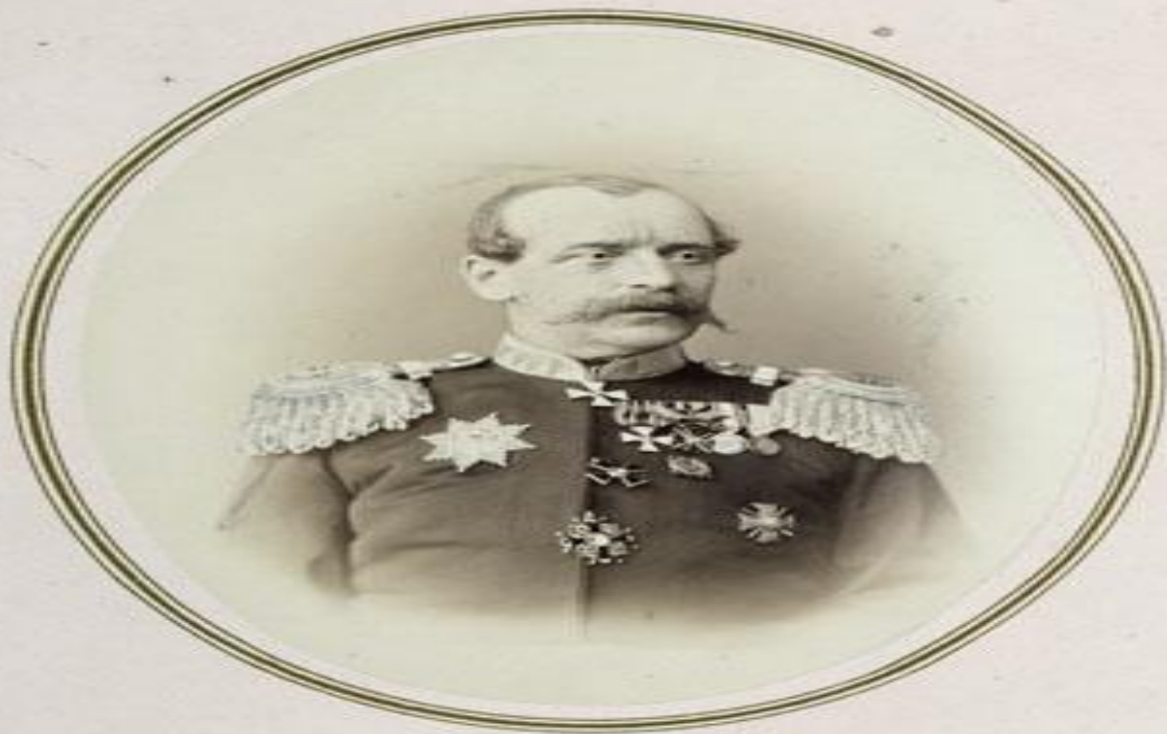
ВОЕННЫЙ ГУБЕРНАТОРЪ СИМИРІЕНСКОЙ ОБЛАСТИ ГЕНЕРАЛЪ ЛЕЙТЕНАНТЪ Г. А. КОЛПАКОВСКІЙ.