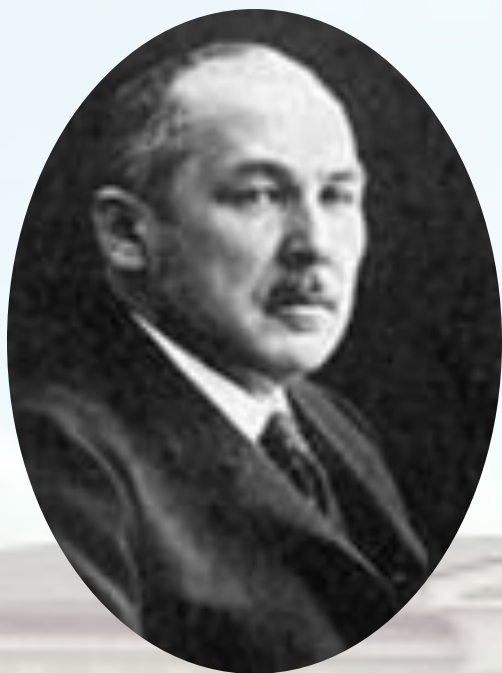
Н.А. Хомяков (октябрист) с 1 ноября 1907 г. по 4 марта 1910 г.