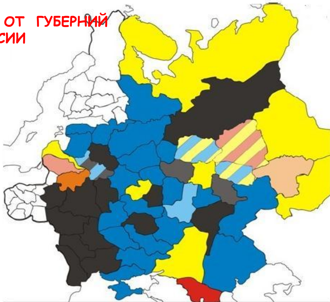
Члены III Думы от губерний Европейской России.