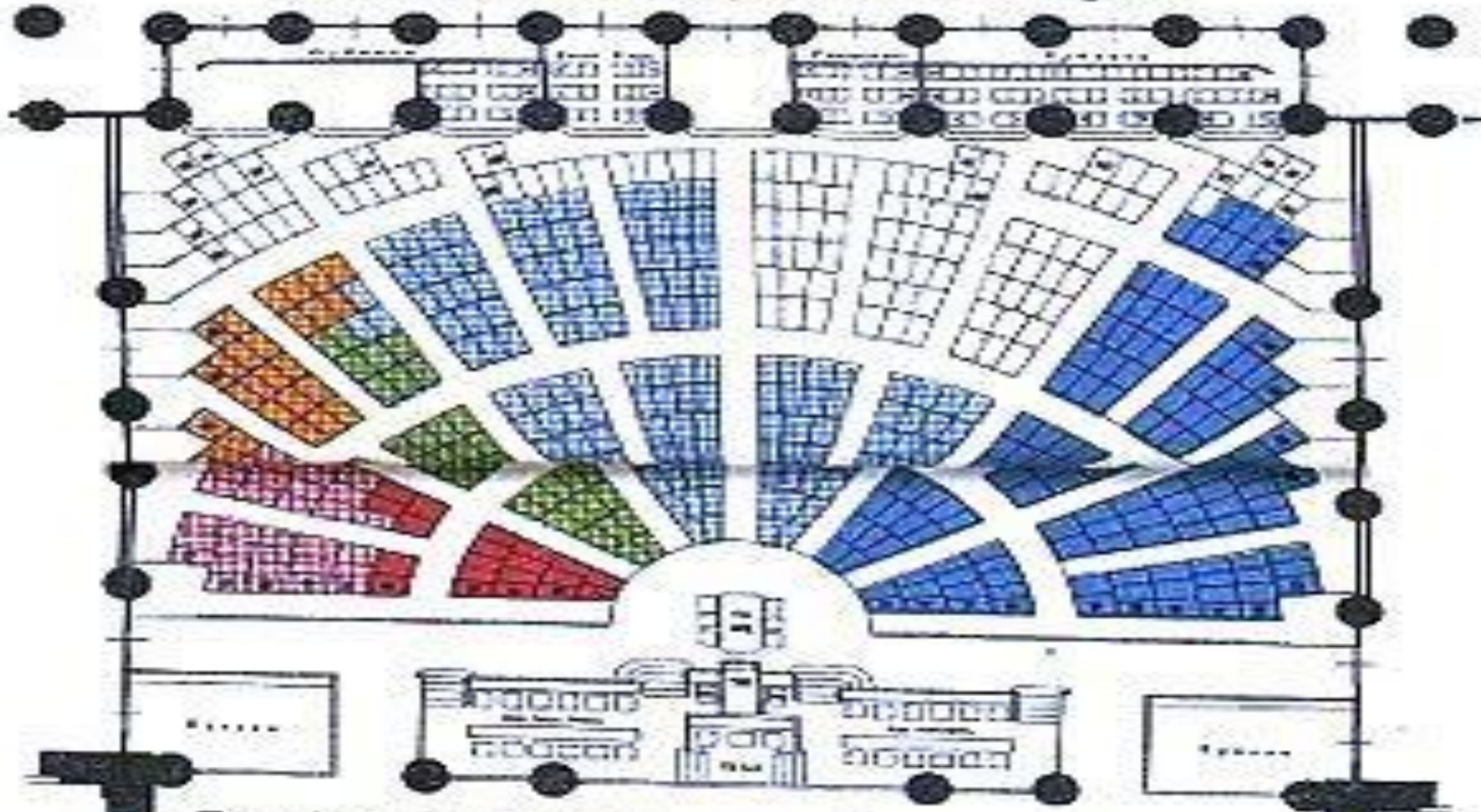
Размѣщеніе депутатскихъ мѣстъ (по партіямъ).