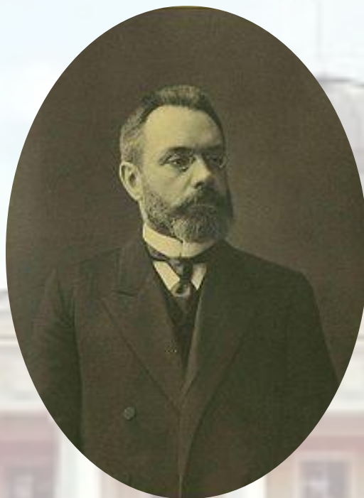
А.И. Гучков (октябрист) с 29 октября 1910 г. по 14 марта 1911 г.