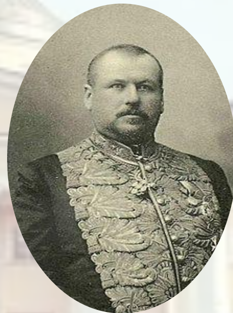
М.В. Родзянко (октябрист) с 22 марта 1911 г. по 9 июня 1912 г.