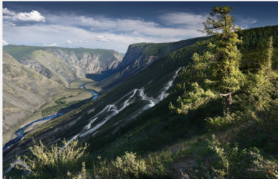
Перевал – Кату-Ярык