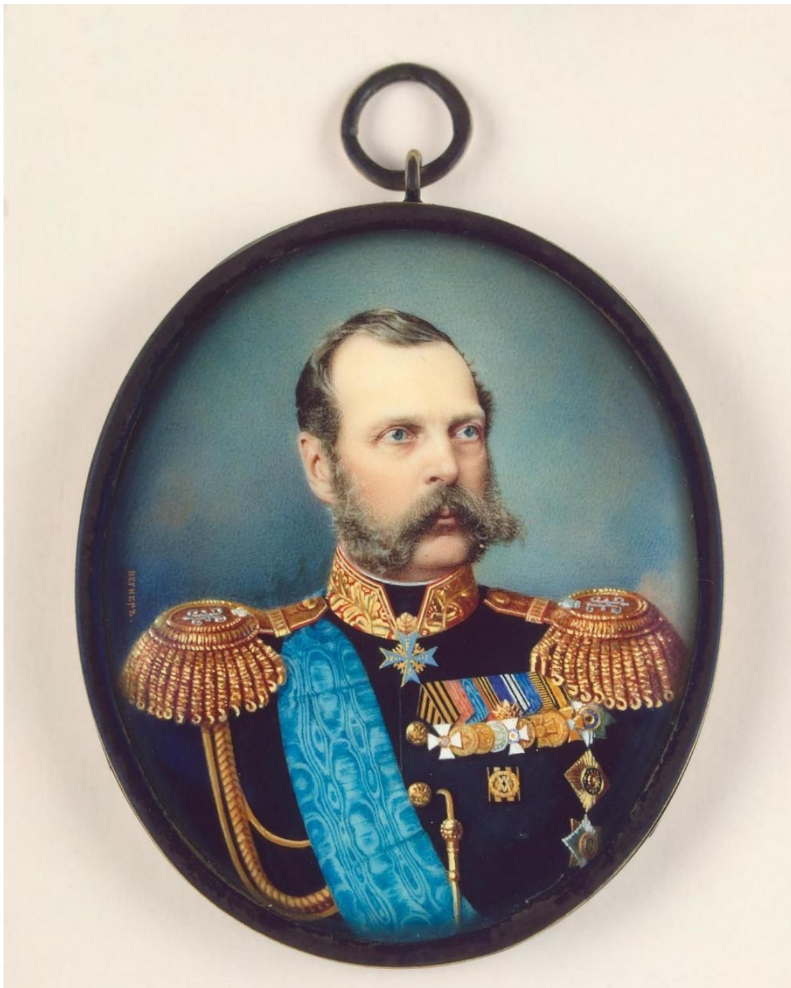
Вегнер, Александр Матвеевич. Миниатюра: Портрет императора Александра II Россия, 1870-е гг. кость, акварель, гуашь 4,5 x 3,8 см