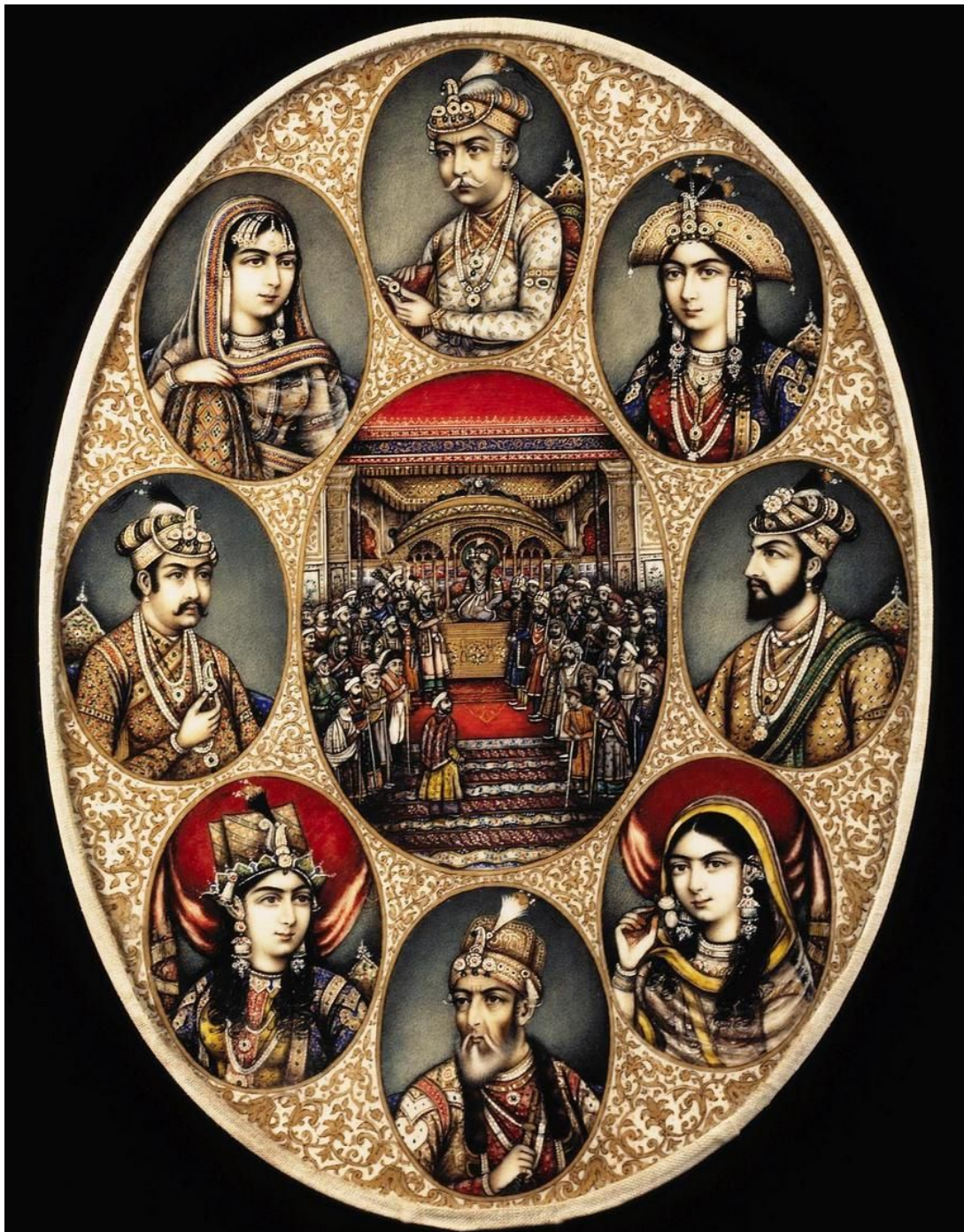
Миниатюра: Сцена дворцового приема и портреты придворных Индия. Дели, XIX в. слоновая кость, акварель 17,9 x 13,1 см