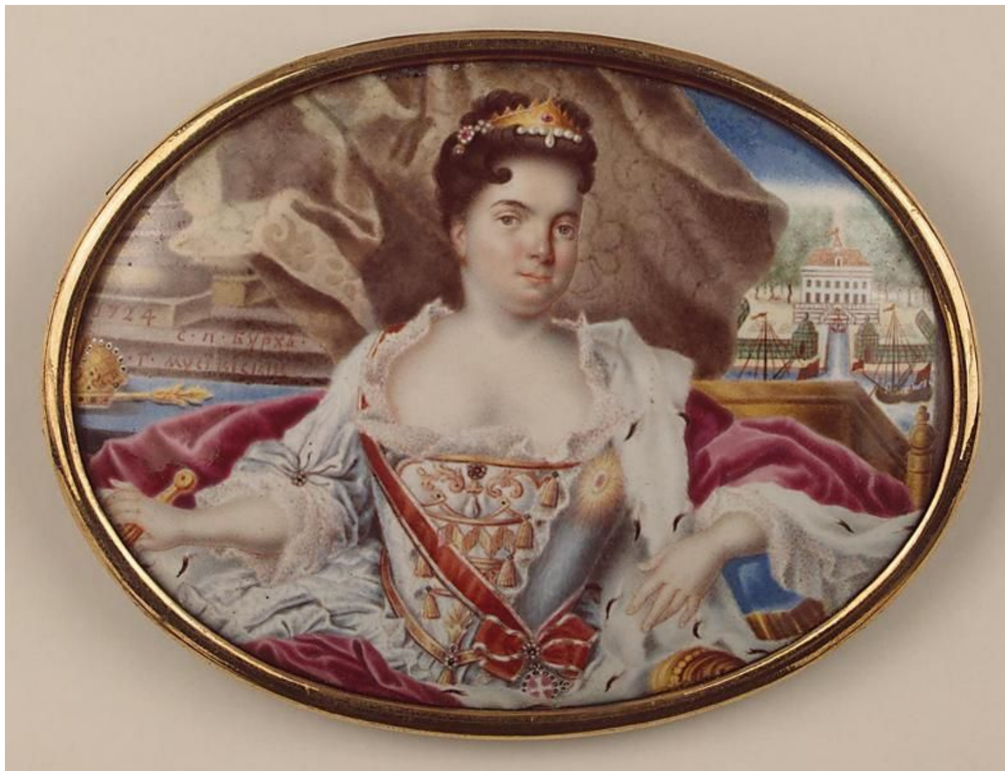
Муסיкийский Григорий Семенович Миниатюра на эмали: Портрет Екатерины I на фоне Екатерингофского дворца в Петербурге, 1724 золото, эмаль, роспись 6,5 x 8,8 см