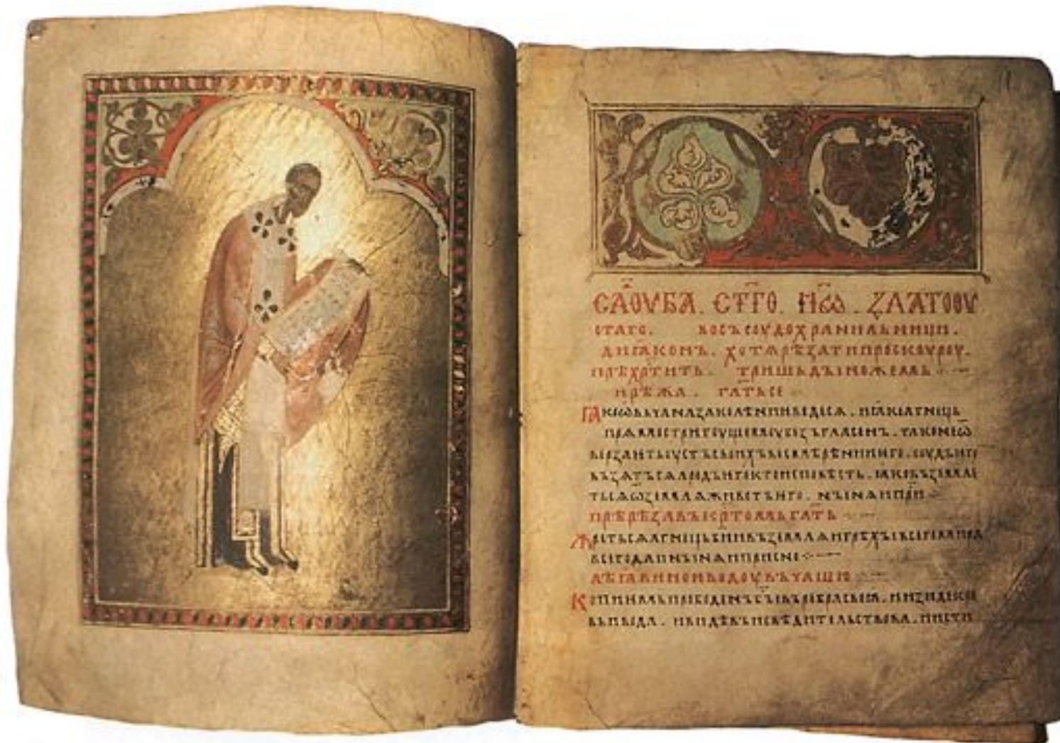
Служебник Варлаама Хутынского. Литургия святого Иоанна Златоуста