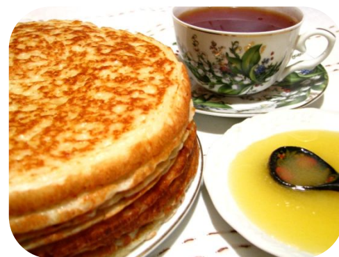
Блины из пшена