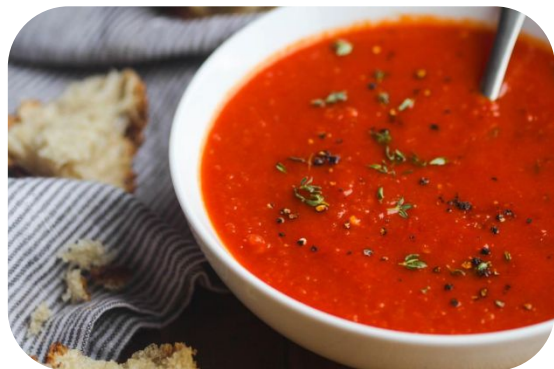
Руб (холодная похлёбка)