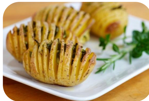
Веера из картошки с салом