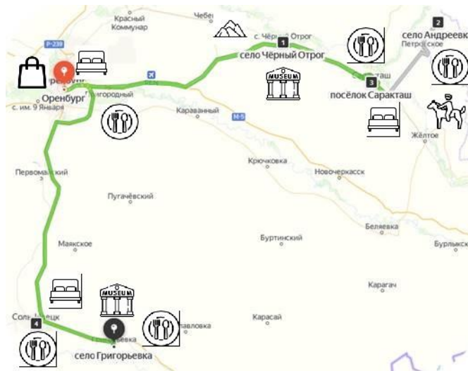
Карта – схема маршрута