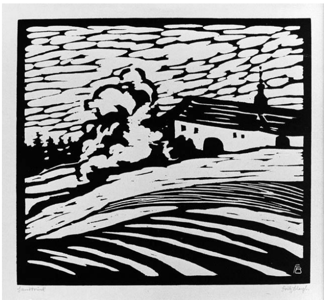
Фриц Блейль линогравюра