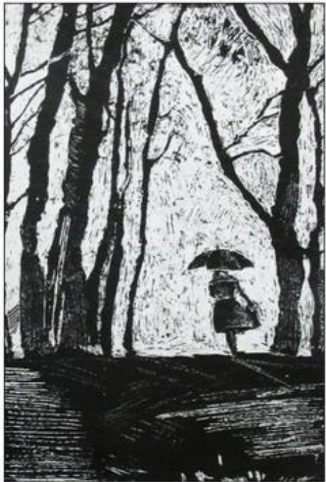
«Девушка с зонтиком», гратография