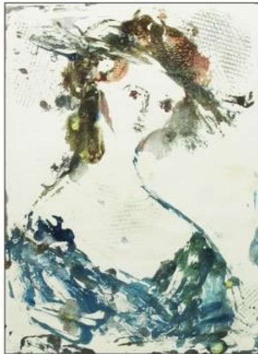
«Женский портрет», монотипия