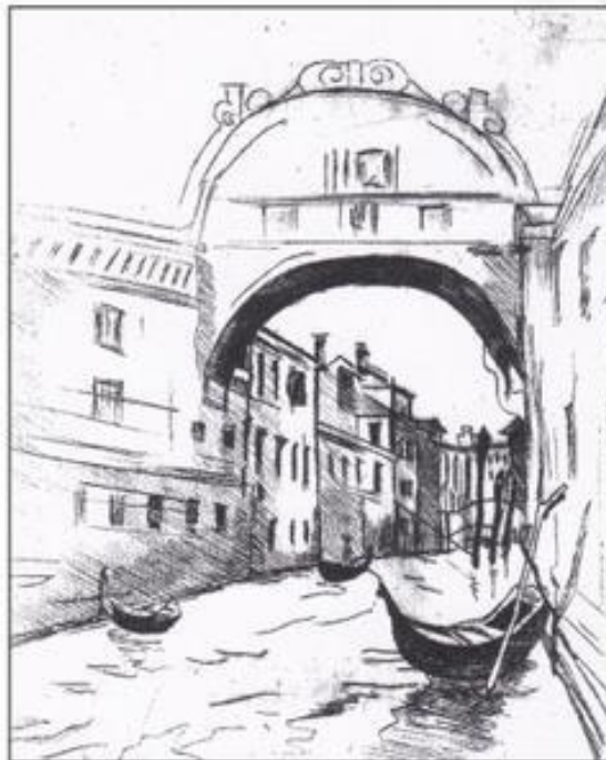
«Пейзаж», гравюра сухая игла