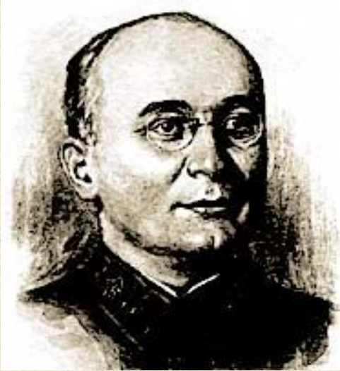
Л. П. Берия