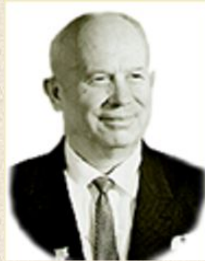
Н. С. Хрущев