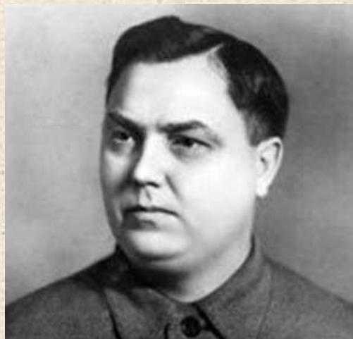
0 Г. М. Маленков (Председатель Совета министров)