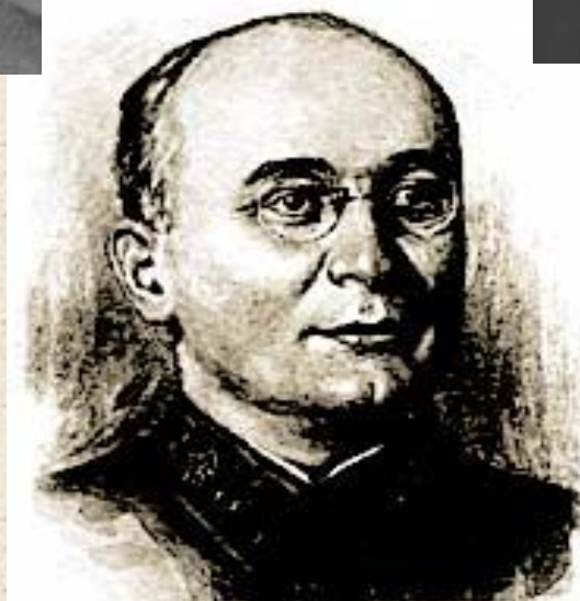
Л. П. Берия (руководитель МВД и внутренних войск)