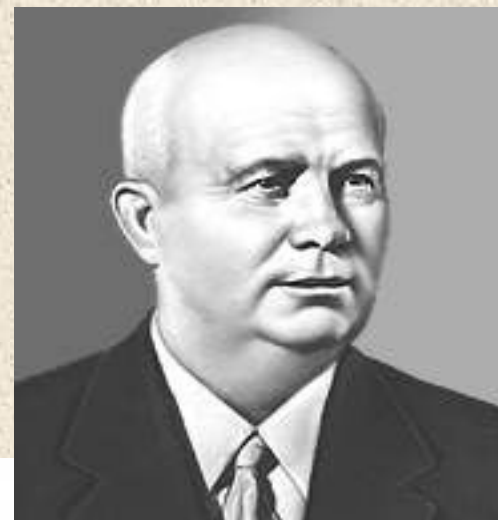
0 Н. С. Хрущев (секретарь ЦК КПСС)