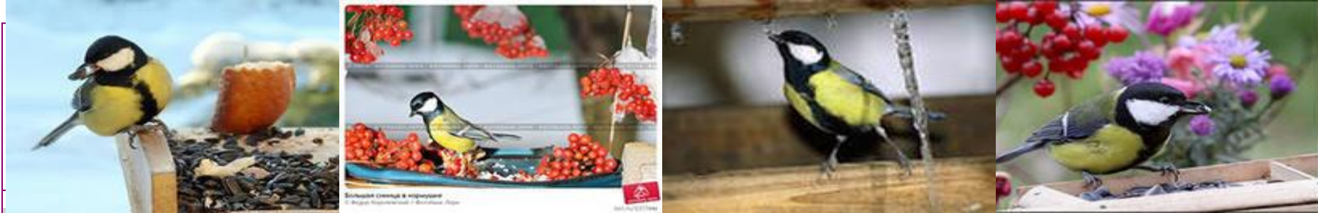
Большая синица в кормушке