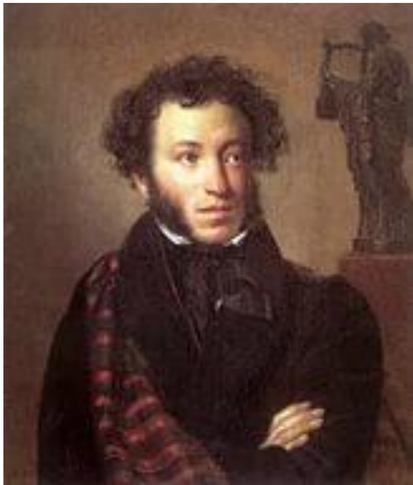
А.Кипренский Портрет поэта А.С. Пушкина