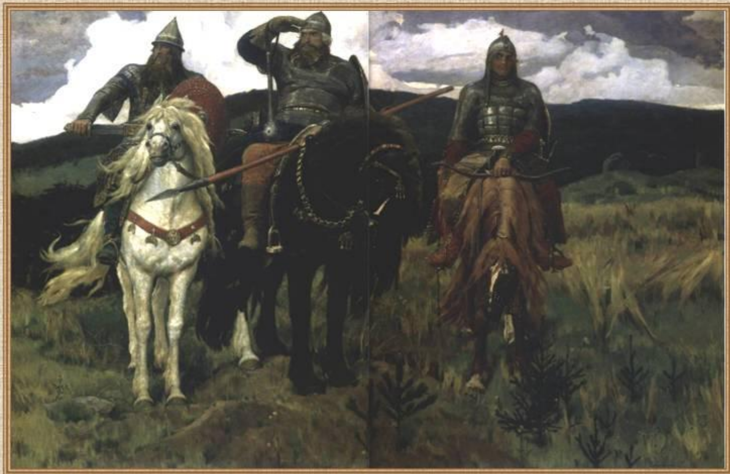
В. М. Васнецов Богатыри, 1881 – 1898 г.г.

Последним крупным приобретением Павла Михайловича Третьякова были "Богатыри" В.М. Васнецова. Они сразу были помещены в зал, где и находятся по сей день.