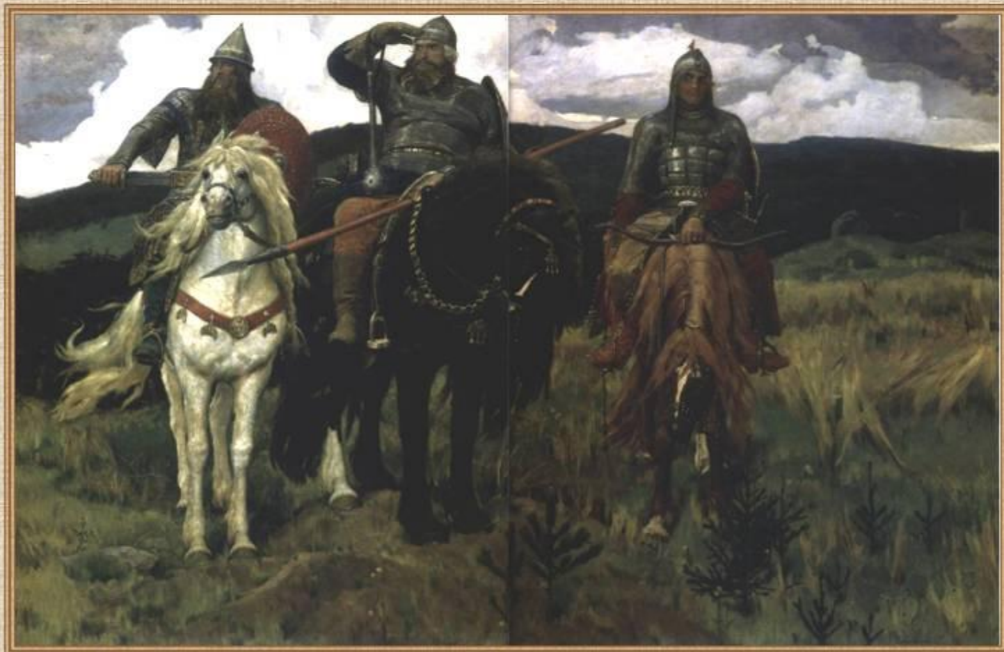
В. М. Васнецов Богатыри, 1881 – 1898 г.г.

Последним крупным приобретением Павла Михайловича Третьякова были "Богатыри" В.М. Васнецова. Они сразу были помещены в зал, где и находятся по сей день.