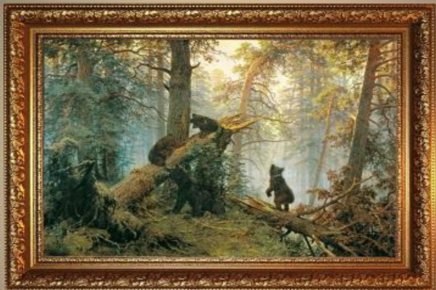
Шишкин И.И. "Утро в сосновом бору" Холст.