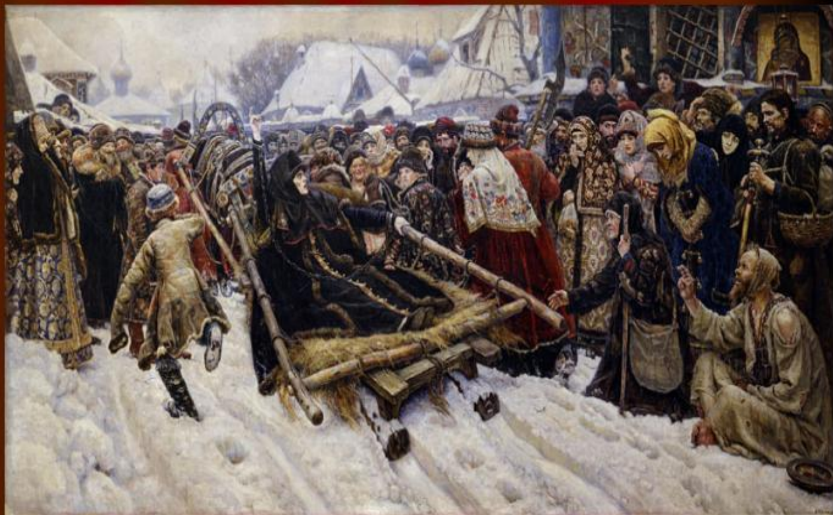
В.И.Суриков. Боярыня Морозова