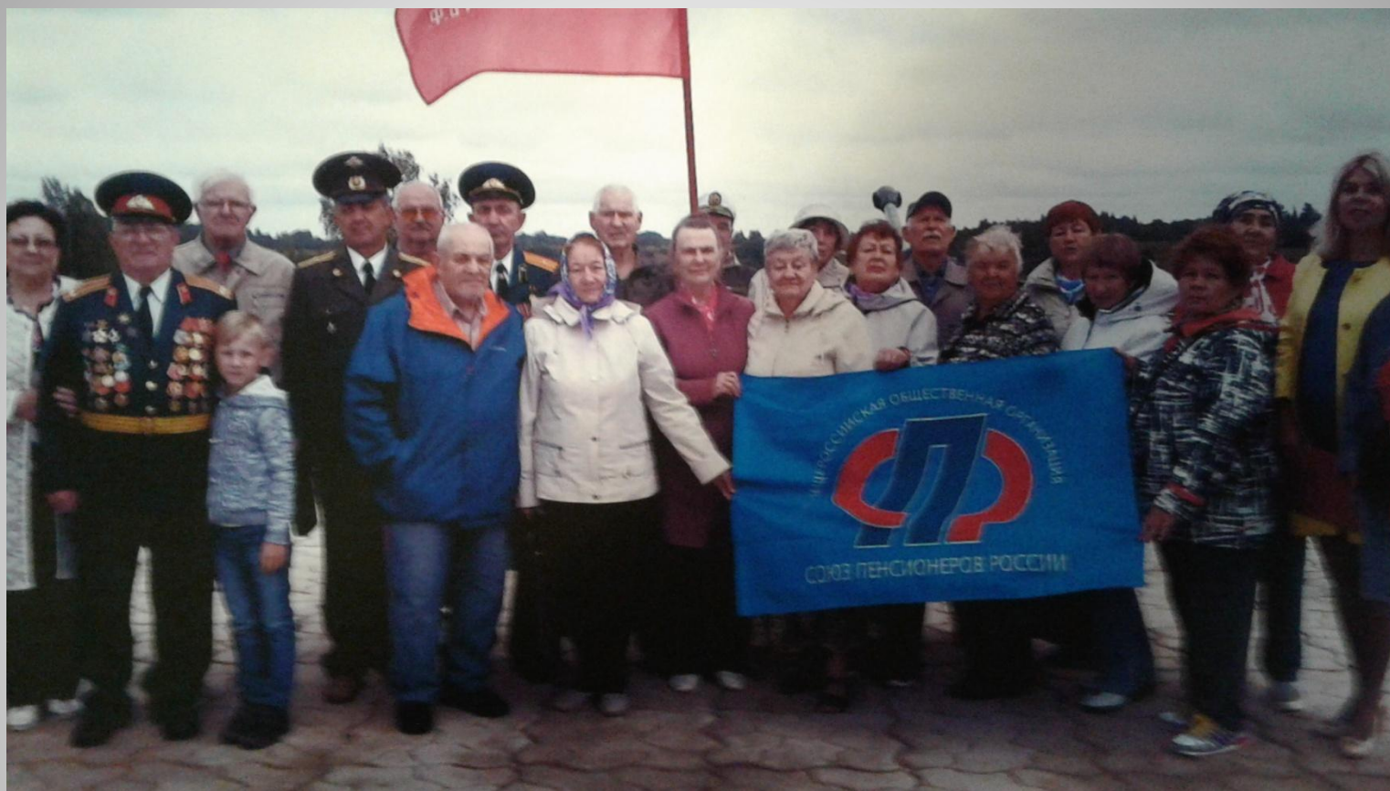
Дедовичское отделение «Союз пенсионеров России» 2020.