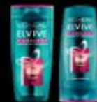
L'ORÉAL® PARIS ELVIVE FIBROLOGY