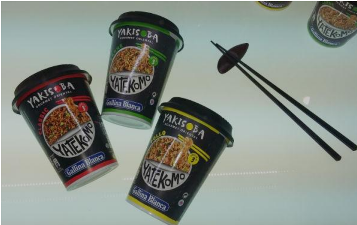
Восточная лапша Yatekomo