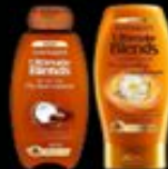
GARNIER ULTIMATE BLENDS