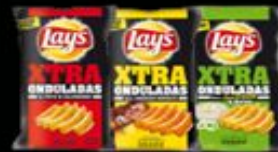
★ LAY'S XTRA