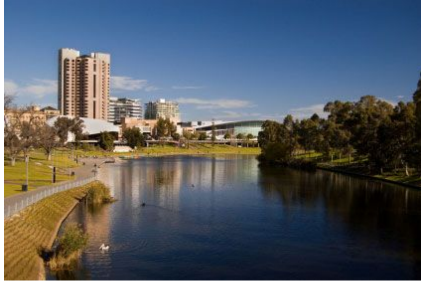
Аделаида (свыше 900 тыс. чел.)