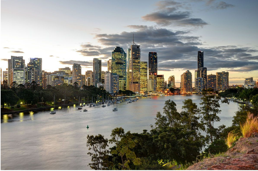
Брисбен (около 1 млн. чел.)