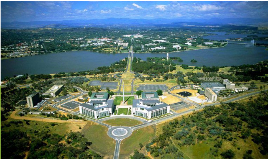
Канберра (300 тыс. чел.)