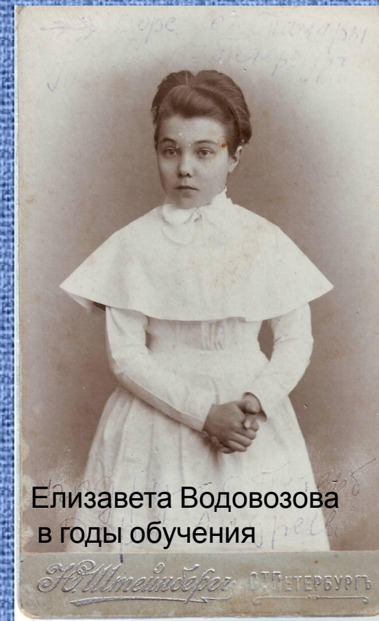
Елизавета Водовозова в годы обучения

«За нерадение в учении и за плохие отметки никто с нас не взыскивал, никого не беспокоила мысль, что воспитанница бросила учиться»