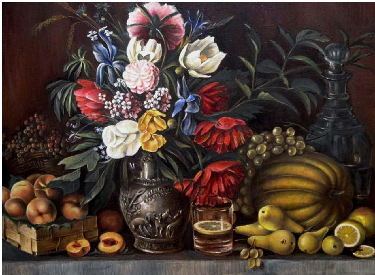
Цветы и плоды (1836г.)