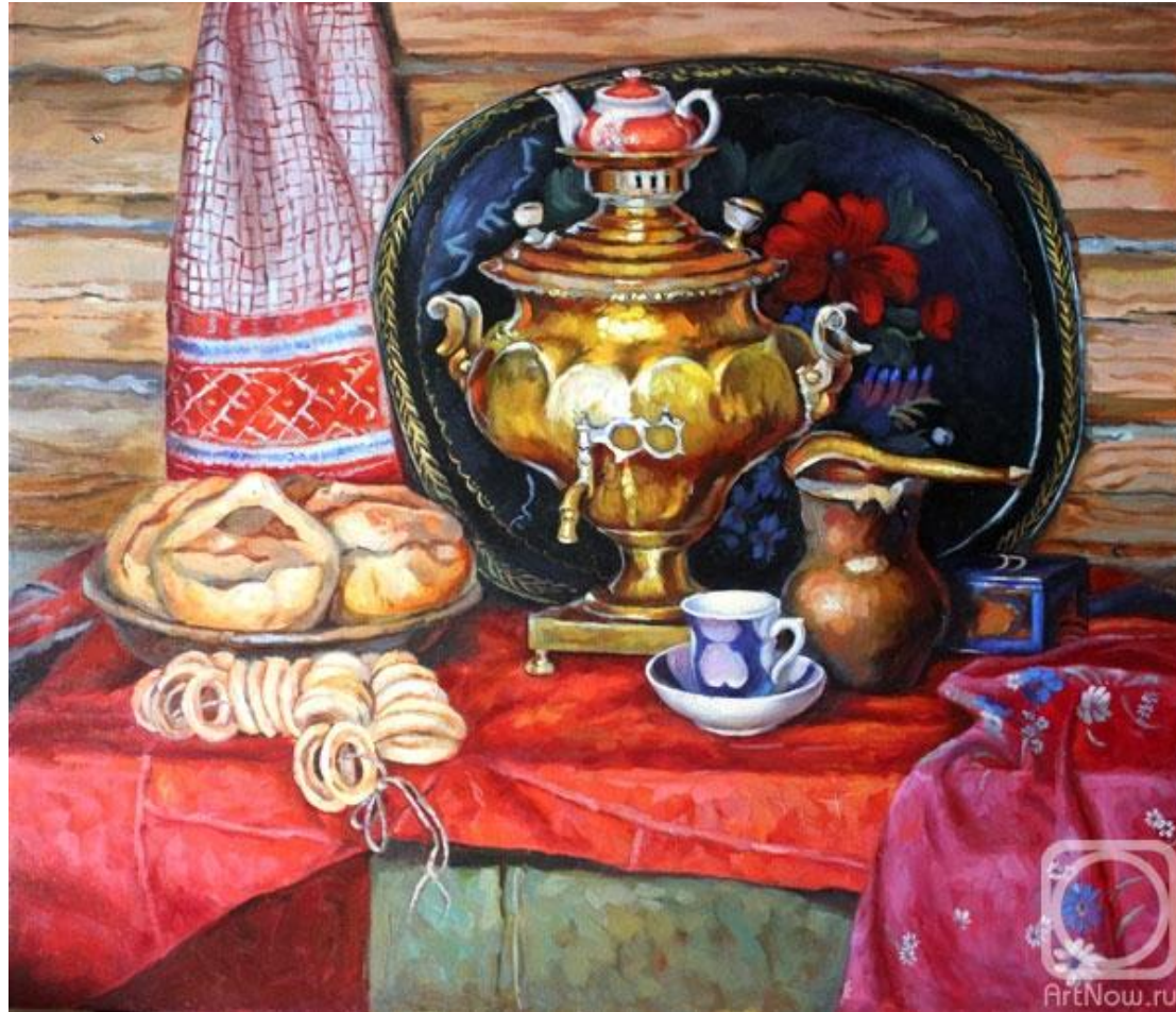
Чай с калачами (1972г.)