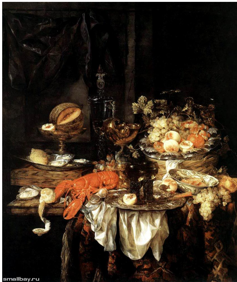
Натюрморт с омаром(1667г.)