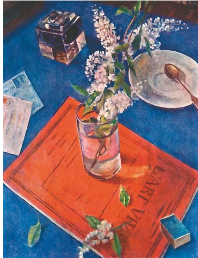
Натюрморт с черёмухой (1932г.)