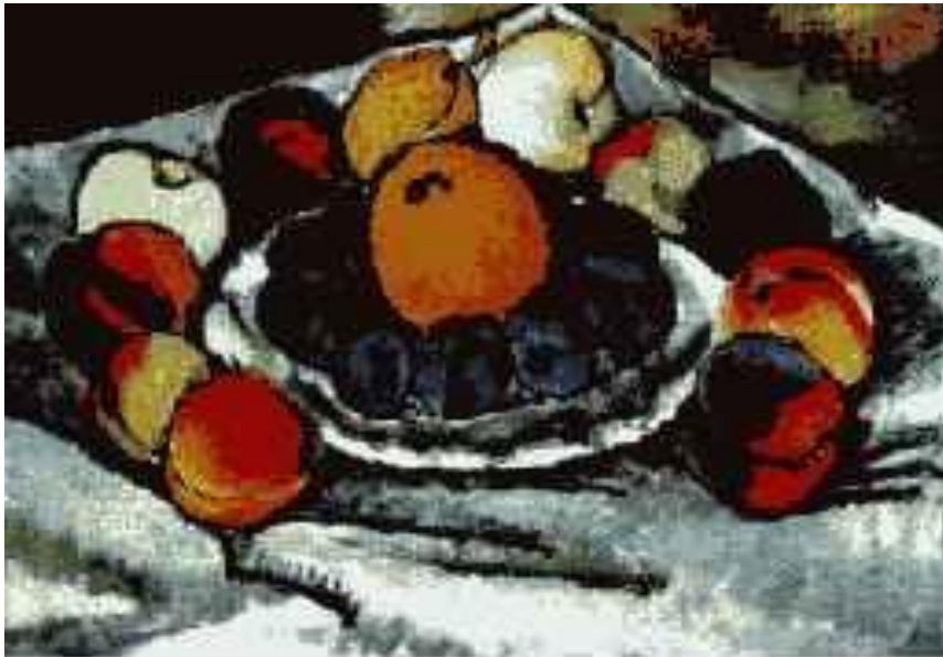
И. Машков. Фрукты на блюде. 1926. Х., масло. ГТГ