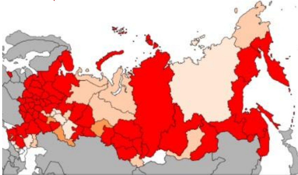
Процент русских по регионам РФ в 2010 году.

Русские — восточнославянский народ, самый многочисленный в России и Европе. Есть крупные диаспоры на Украине, в Казахстане, США, Германии и ряде других стран. Культура русского народа имеет давние традиции и является фундаментом современной культуры всей России. Родной и национальный язык — русский. Верующие русские — в основном православные.