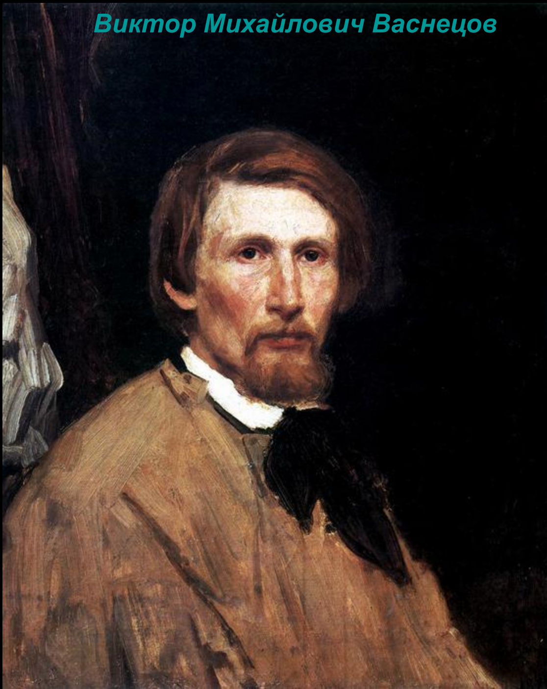
Виктор Михайлович Васнецов