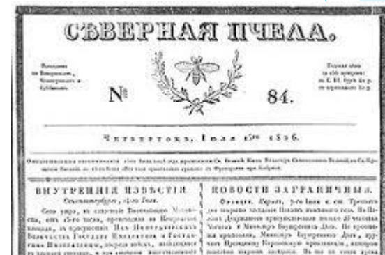
«Северная пчела» Ф.В. Булгарина