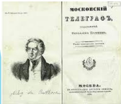
«Московский телеграф» под изданием Н.А. Полевого.