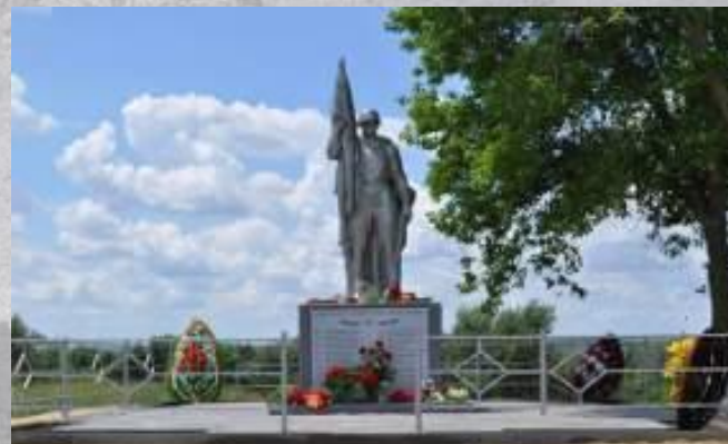
х. Красный Яр