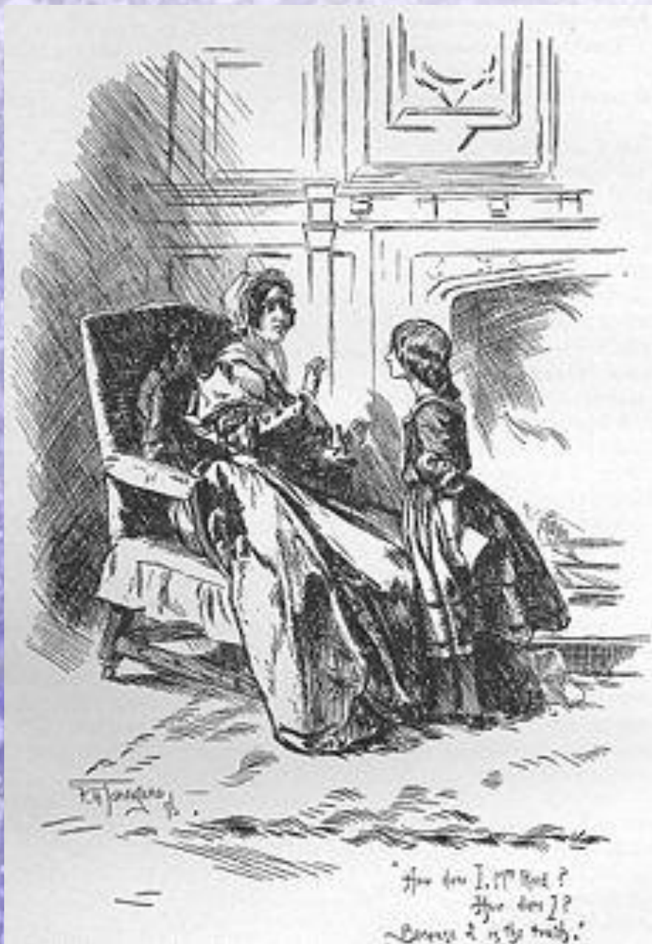
Маленькая Джейн спорит со своей опекуншей миссис Рид. Иллюстрация Ф.Таунсенда