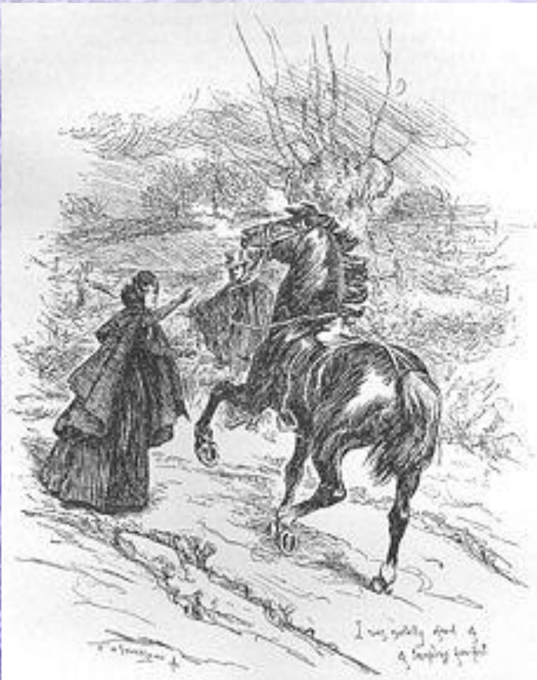
Джейн Эйр впервые встречает мистера Рочестера