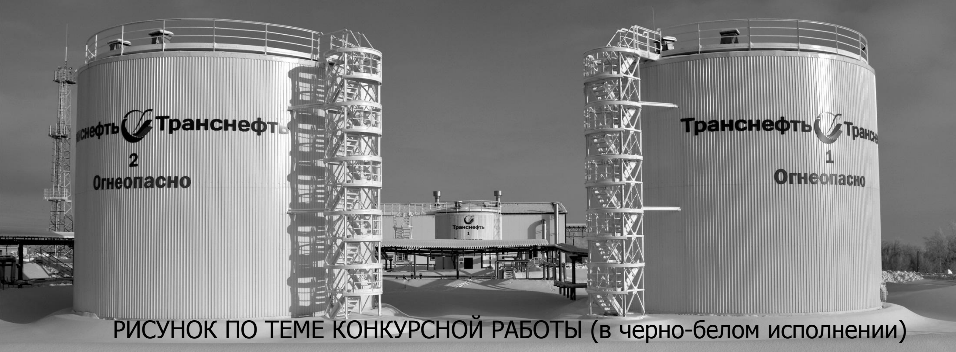
РИСУНОК ПО ТЕМЕ КОНКУРСНОЙ РАБОТЫ (в черно-белом исполнении)

ТЕМА КОНКУРСНОЙ РАБОТЫ: НАЗВАНИЕ КОНКУРСНОЙ РАБОТЫ_ШРИФТ И ЦВЕТ НЕ МЕНЯЕМ_ ВСЕ БУКВЫ ЗАГЛАВНЫЕ