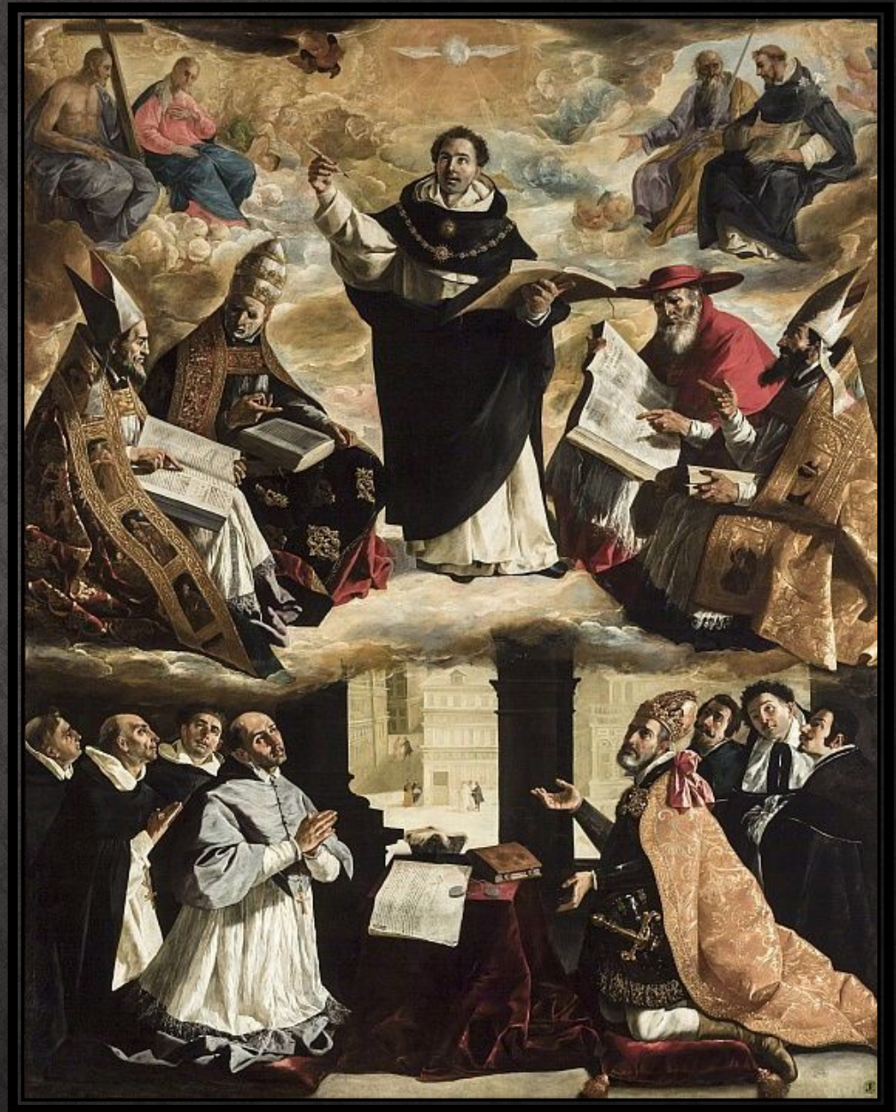
Апофеоз св. Фомы Аквинского