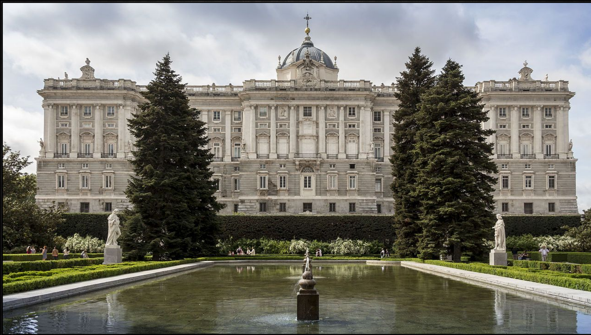
Королевский дворец в Мадриде