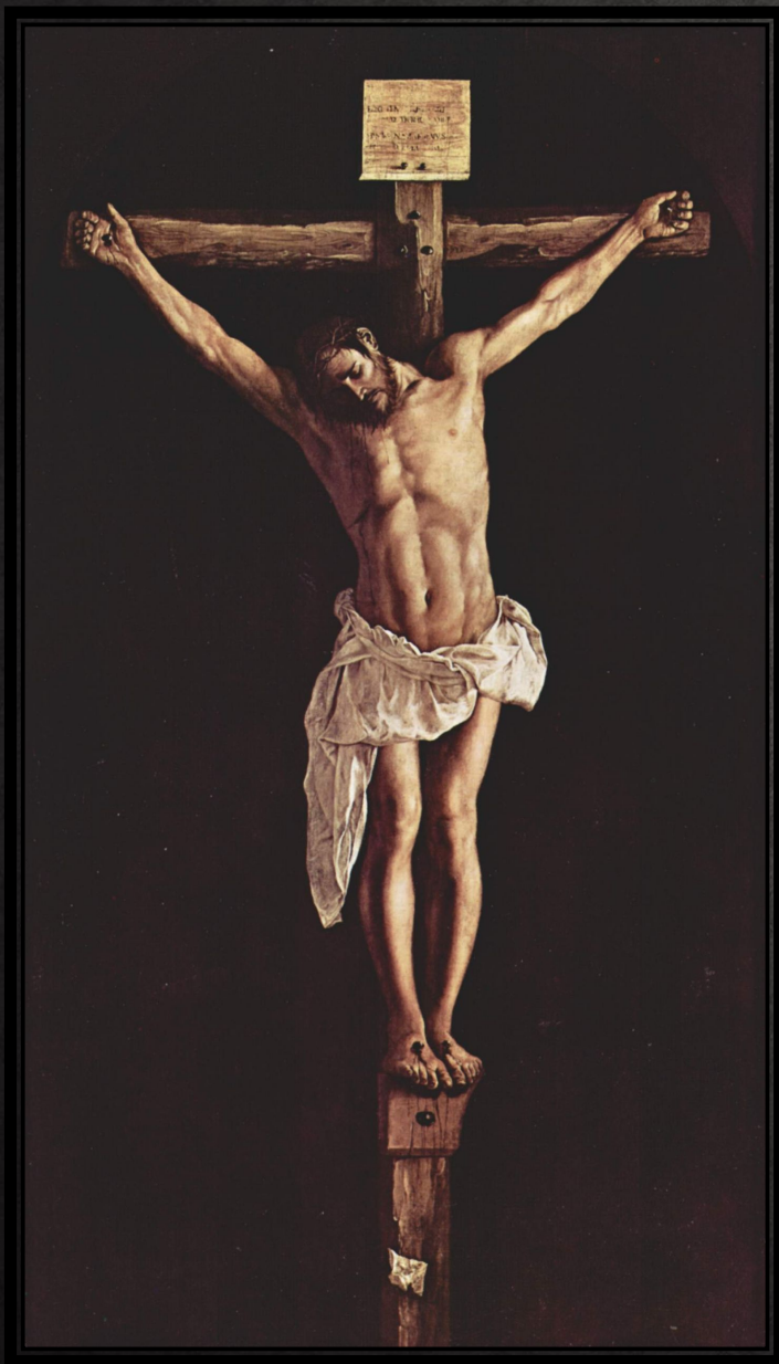
Христос на кресте