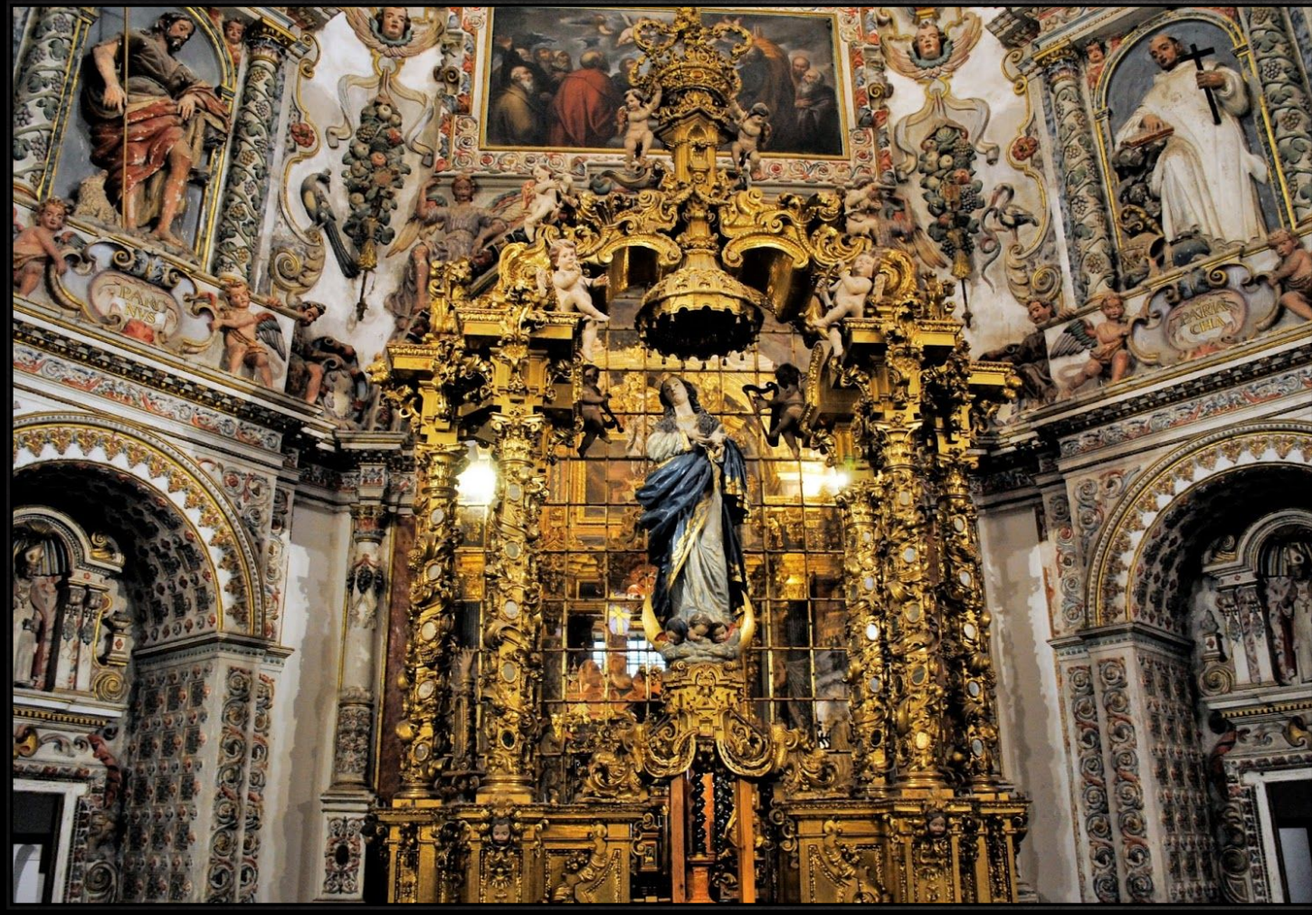
Картезианский монастырь Гранады