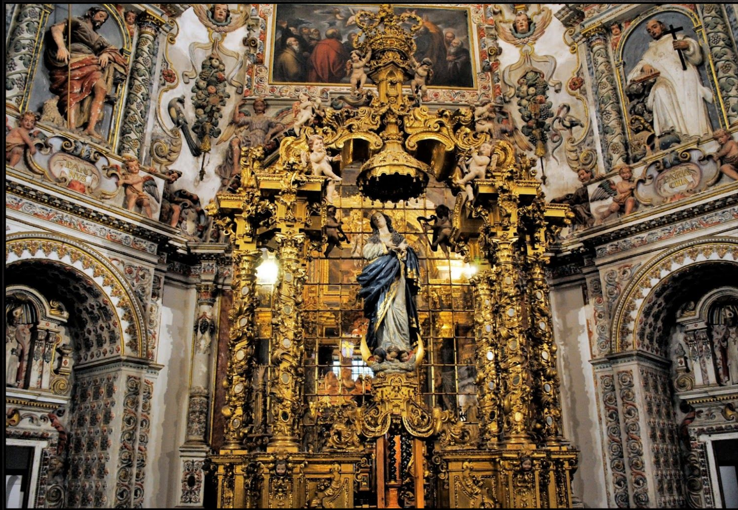
Картезианский монастырь Гранады