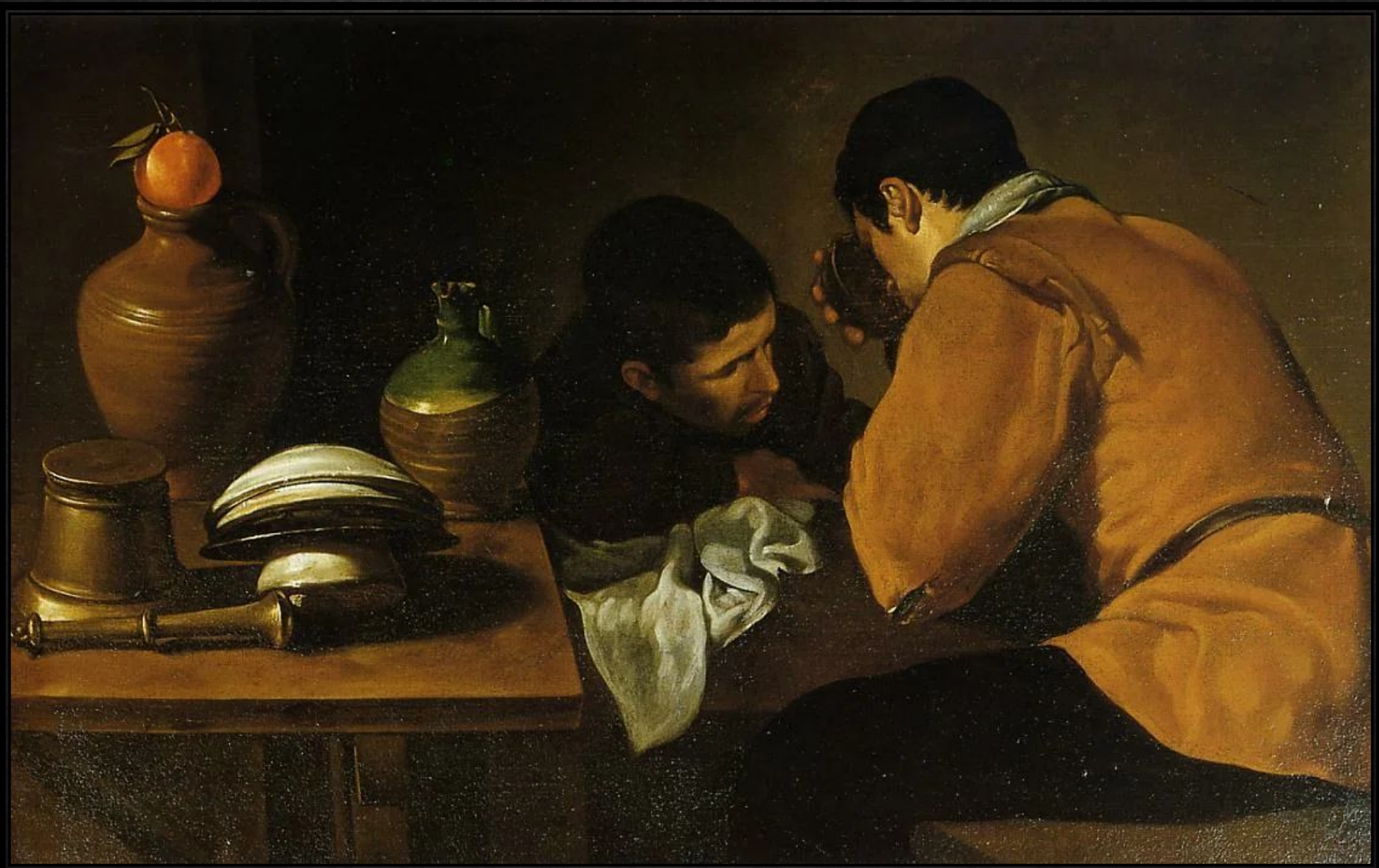
Два молодых человека за столом