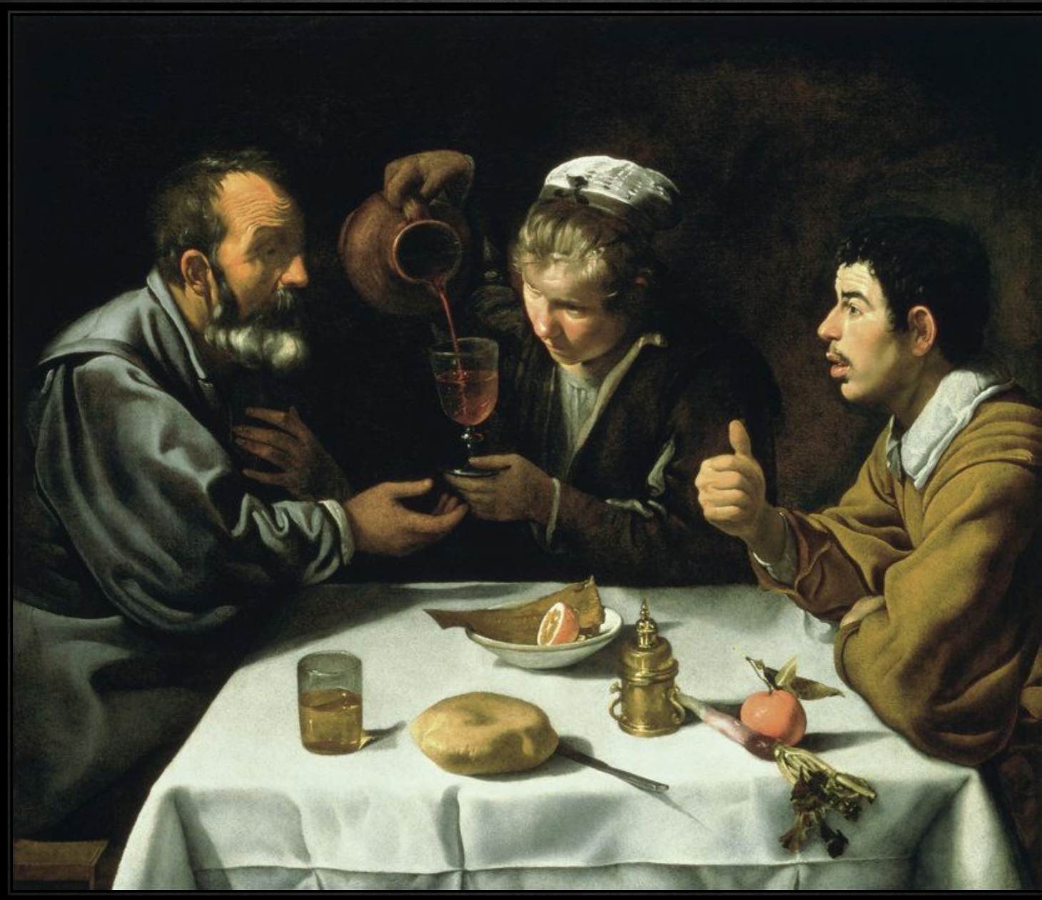
Утренняя трапеза крестьянина