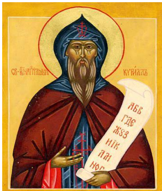
Святой равноапостольный Кирилл

Кирилл(Константин) получил блестящее образование при императорском дворе в столице Византии – Константинополе. Быстро изучил грамматику, арифметику, геометрию, астрономию, музыку, знал 22 языка. Интерес к наукам, упорство в учении, трудолюбие – всё это сделало его одним из самых образованных людей Византии.