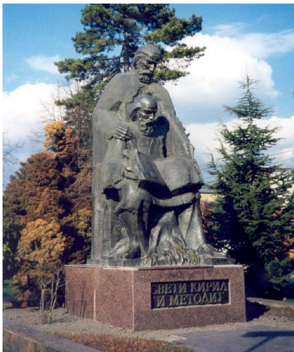
Македонија. Охрид. Памятник Кириллу и Мефодию

Уже в IX – X веках на родине Кирилла и Мефодия стали зарождаться первые традиции прославления и почитания создателей славянской письменности. Но скоро римская церковь стала выступать против славянского языка, называя его варварским. Несмотря на это, имена Кирилла и Мефодия продолжали жить среди славянского народа, а в середине XIV века официально их причислили к святым.