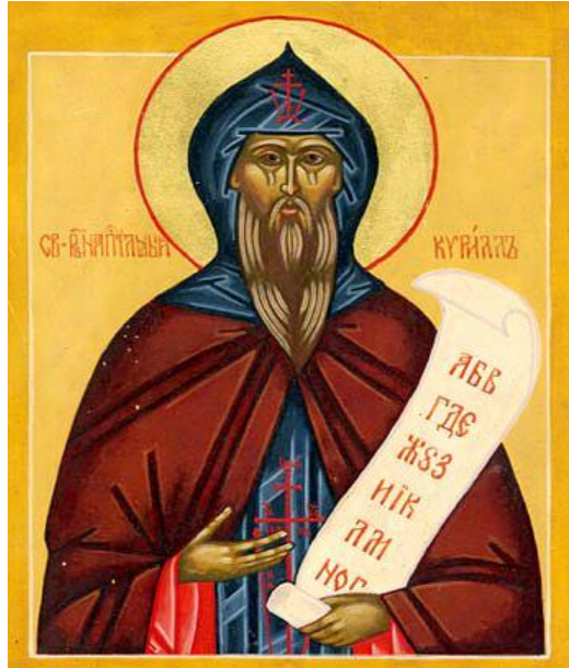
Святой равноапостольный Кирилл

Кирилл(Константин) получил блестящее образование при императорском дворе в столице Византии – Константинополе. Быстро изучил грамматику, арифметику, геометрию, астрономию, музыку, знал 22 языка. Интерес к наукам, упорство в учении, трудолюбие – всё это сделало его одним из самых образованных людей Византии.