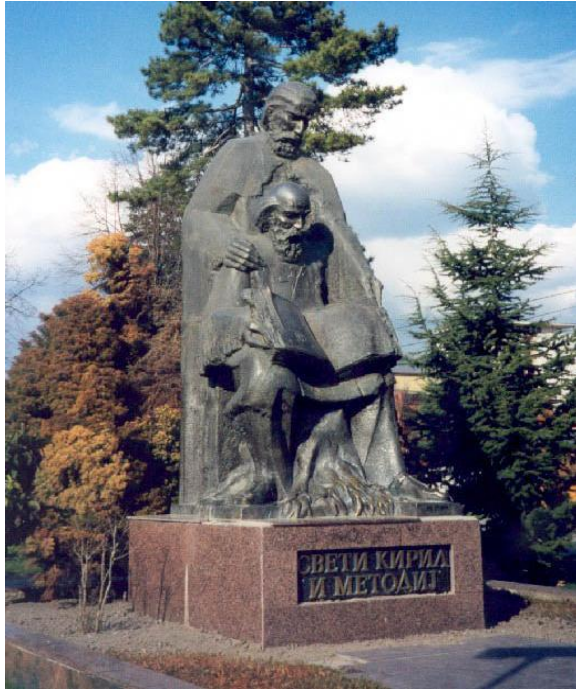
Македонија. Охрид. Памятник Кириллу и Мефодию

Уже в IX – X веках на родине Кирилла и Мефодия стали зарождаться первые традиции прославления и почитания создателей славянской письменности. Но скоро римская церковь стала выступать против славянского языка, называя его варварским. Несмотря на это, имена Кирилла и Мефодия продолжали жить среди славянского народа, а в середине XIV века официально их причислили к святым.