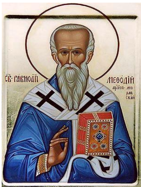
Святой равноапостольный Методий

Методий рано поступил на военную службу. Около 852 года он принял монашеский постриг, отказавшись от сана архиепископа, стал игуменом монастыря.