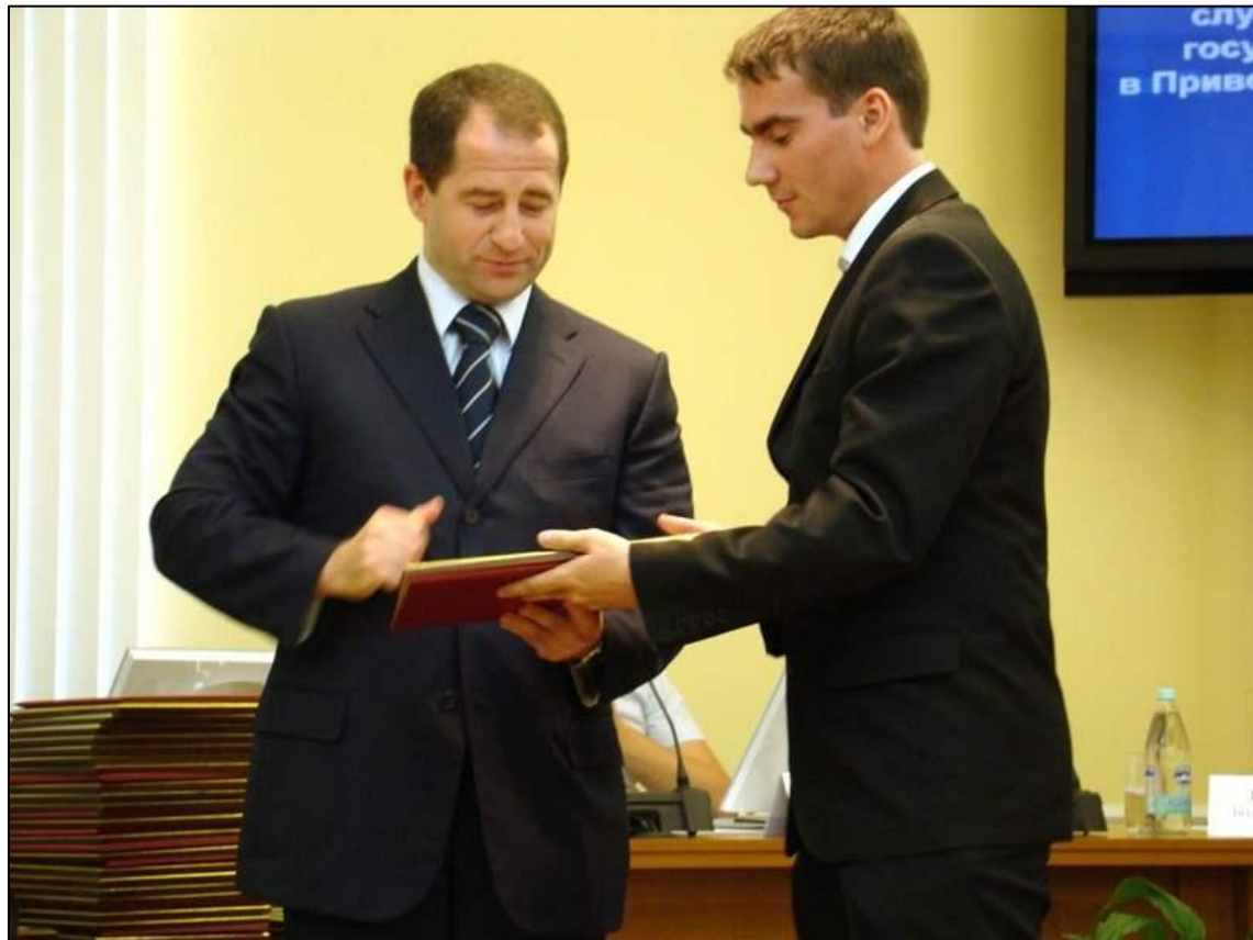
М. В. Бабич, полпред Президента РФ в ПФО