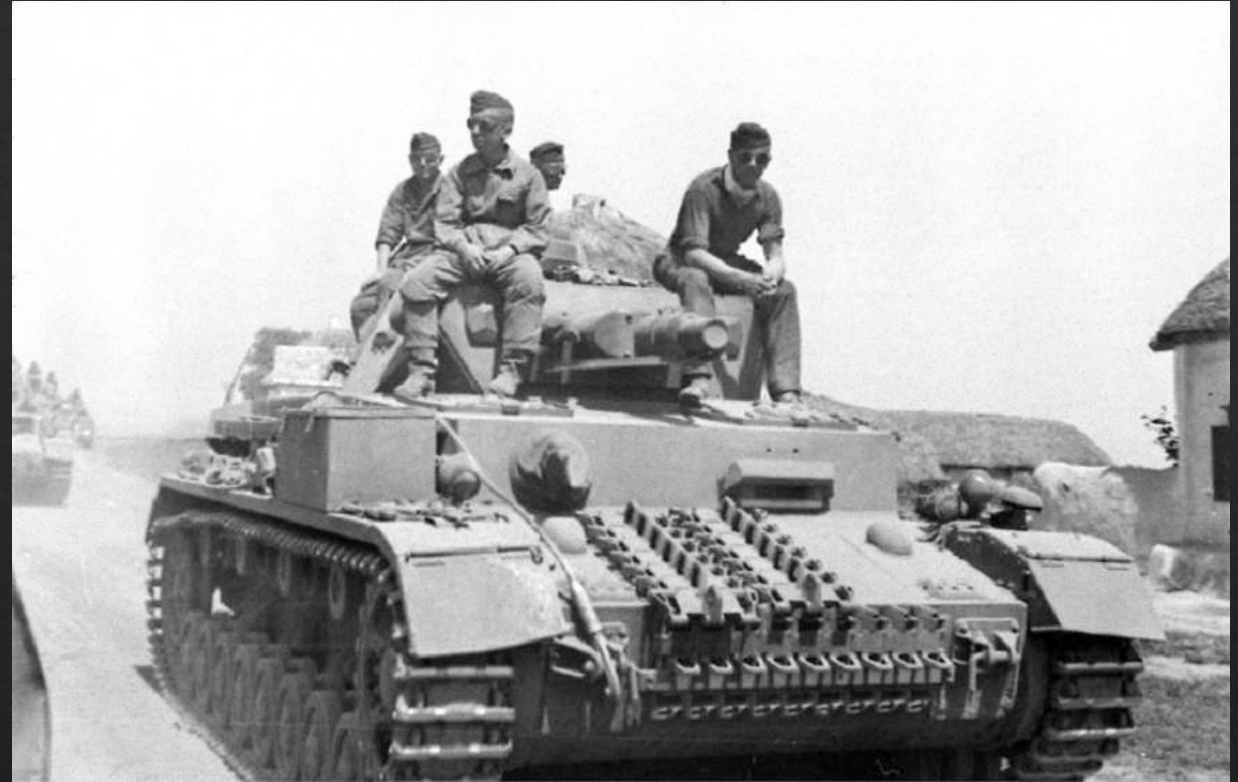
Немецкие солдаты на танке Pz. IV, июнь 1942.

Наступление войск нацистской Германии и её союзников продолжалось с 17 июля по 18 ноября 1942 года, его целью был захват большой излучины Дона, волгодонского перешейка и Сталинграда. Осуществление этого плана блокировало бы транспортное сообщение между центральными районами Союза ССР и Кавказом, создало бы плацдарм для дальнейшего наступления с целью захвата кавказских месторождений нефти.