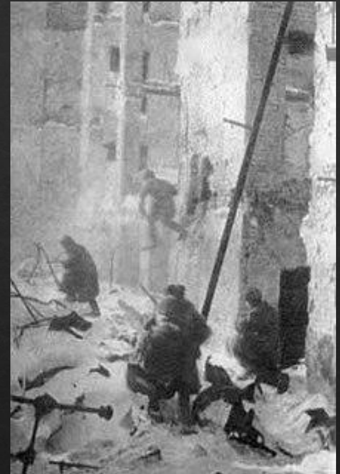
Уличные бои в Сталинграде

Следствием победы СССР в битве стало то, что Турция отказалась от вторжения в СССР весной 1943 года, Япония не предприняла планируемый Сибирский поход, Румыния (Михай I), Италия (Пьетро Бадольо), Венгрия (Миклош Каллаи) стали искать возможности для выхода из войны и заключения сепаратного мира с Великобританией и США.