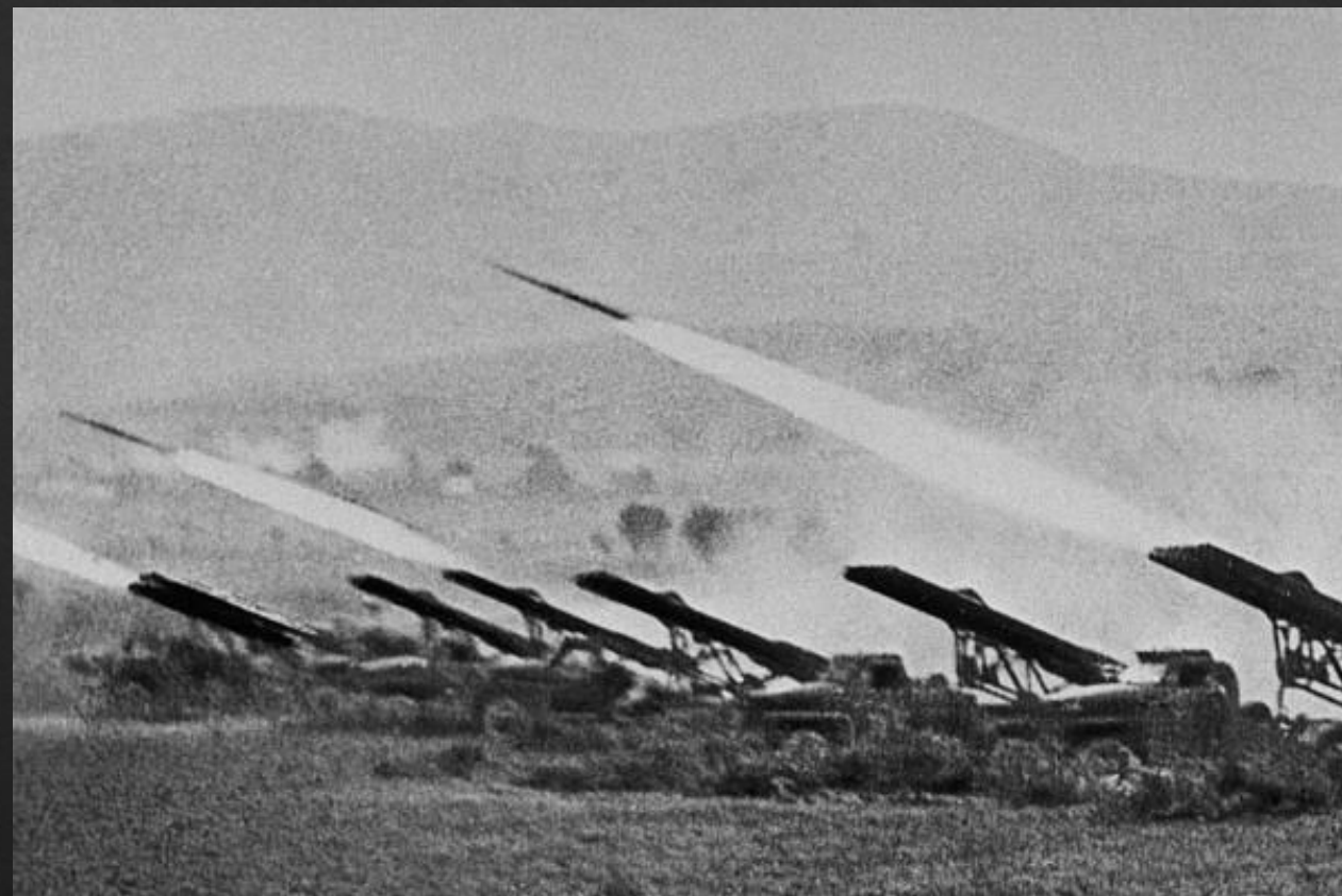
Советские реактивные установки залпового огня (Катюши) наносят удар по врагу, 6 октября 1942.

Согласно данным исследования ВЦИОМ, проведённого в январе 2018 года и приуроченного к 75-летию со дня разгрома фашистских войск в Сталинградской битве, 55 % опрошенных совершеннолетних россиян считают победу в Сталинградской битве решающим событием для исхода Великой Отечественной войны.