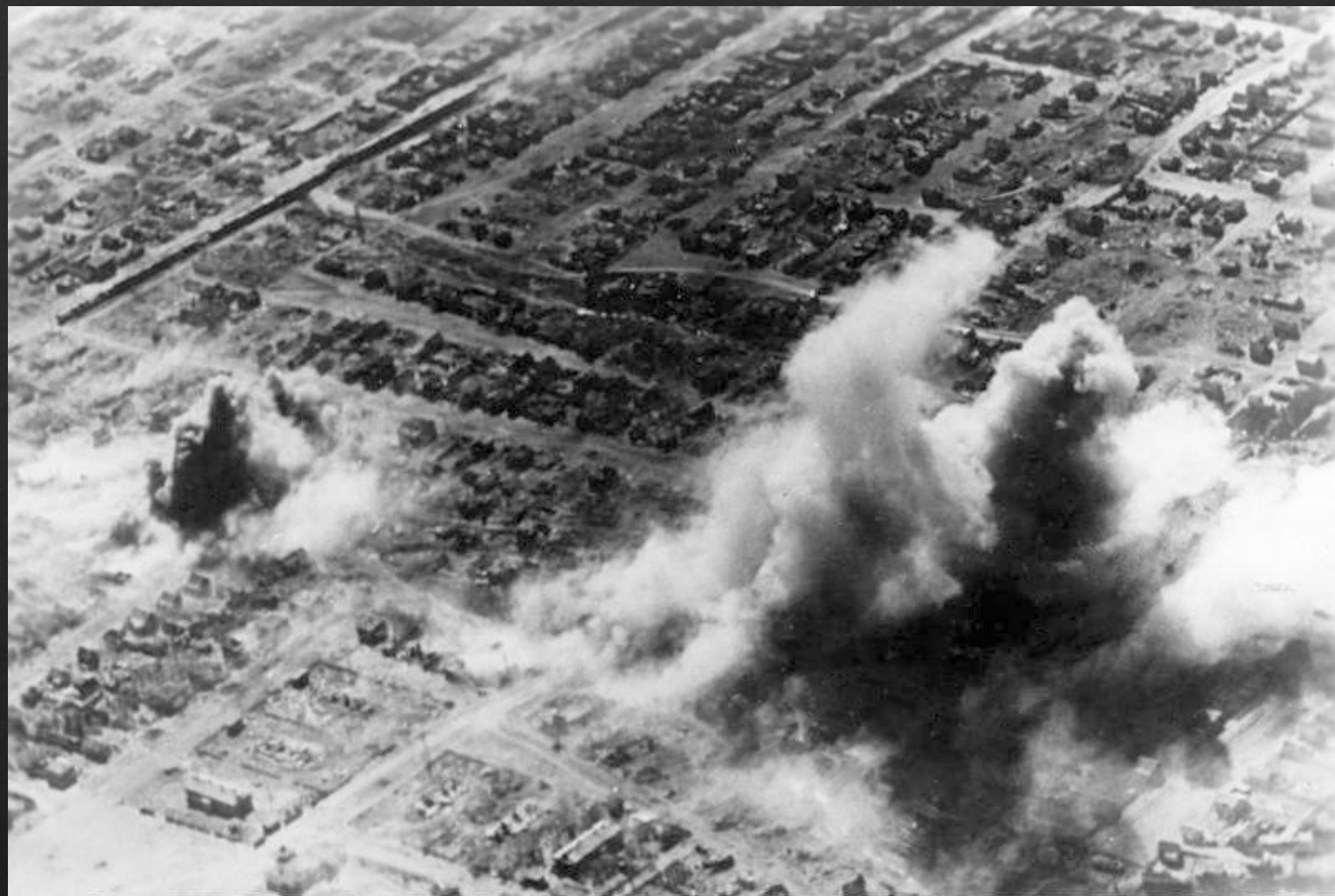
Люфтваффе проводит бомбардировку жилых районов Сталинграда, октябрь 1942 года

Эта победа Красной армии, после череды поражений 1941—1942 годов, положила начало «коренному перелому» (перехвату советским командованием стратегической инициативы) не только в Великой Отечественной, но и во всей Второй мировой войне.