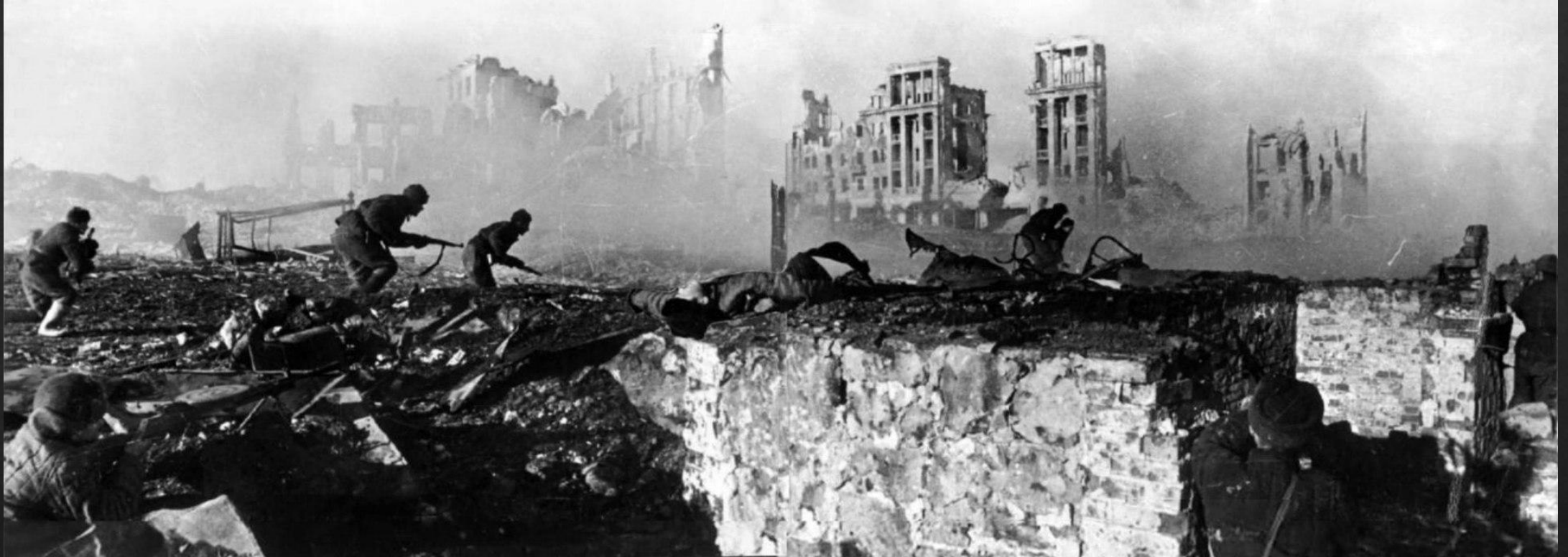
Советские солдаты штурмуют дом в Сталинграде, февраль 1943 года.