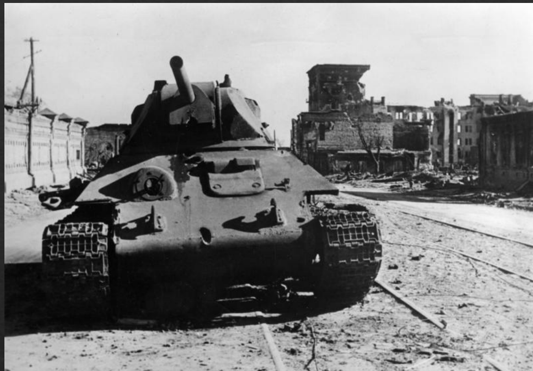
Подбитый советский танк Т-34 в Сталинграде, 8 октября 1942 года

За июль — ноябрь 1942 года Красной армии удалось заставить противника увязнуть в оборонительных боях, а до февраля 1943 года — окружить группировку немецко-фашистских захватчиков в результате контрнаступательной операции «Уран», отбить деблокирующий немецкий удар «Винтергевиттер» и сжать кольцо окружения к развалинам Сталинграда. Окружённая группировка 6-й армии капитулировала 2 февраля 1943 года, в том числе генерал-фельдмаршал Фридрих Паулюс и ещё 24 генерала вермахта.