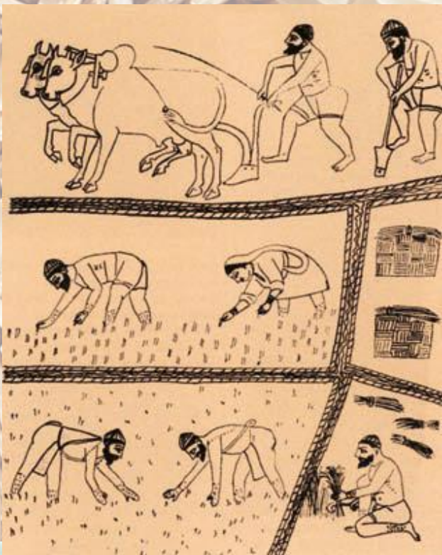
Рис является одним из древнейших и наиболее продуктивных злаков на Земле. Родиной риса считается Азия.