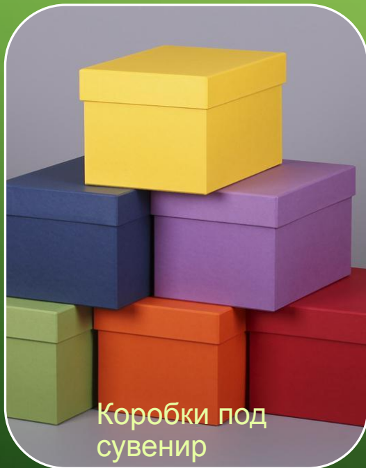
Коробки под сувенир