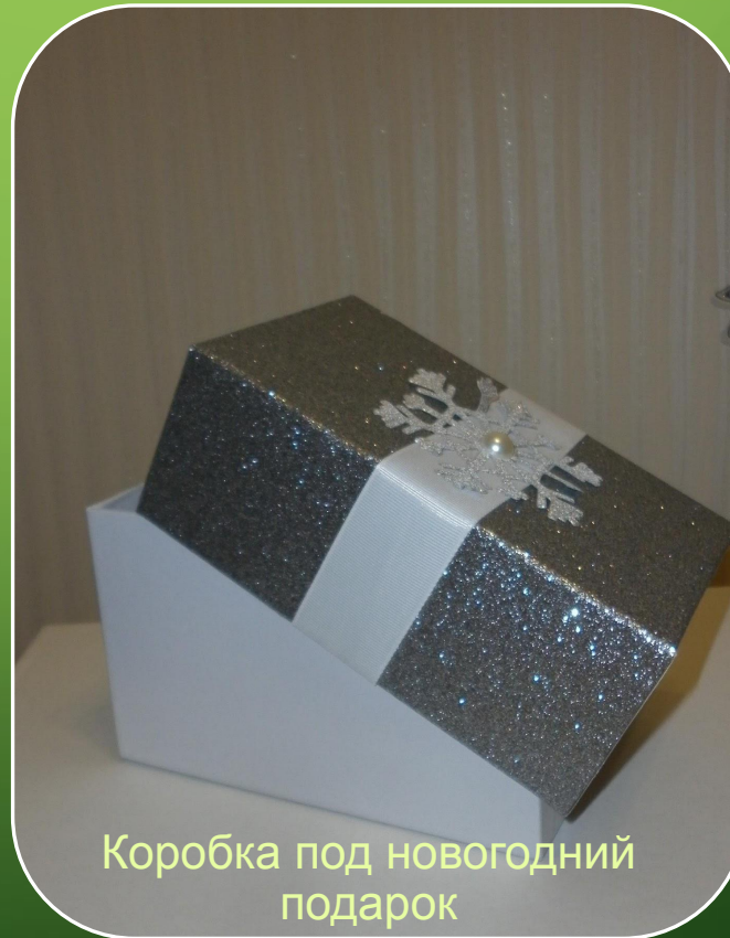
Коробка под новогодний подарок