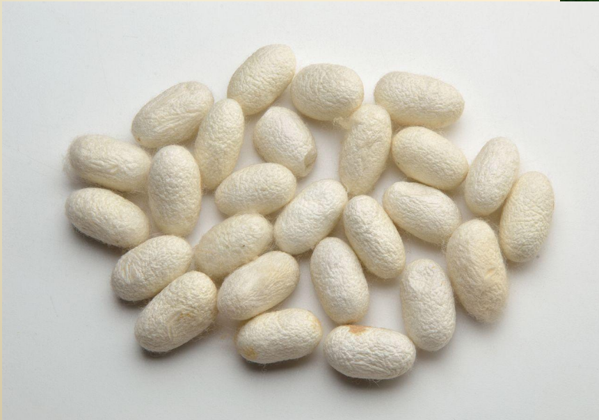
Коконьы тутового шелкопряда