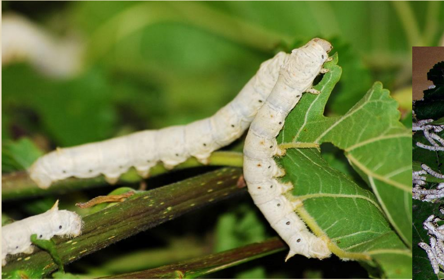
Гусеницы тутового шелкопряда