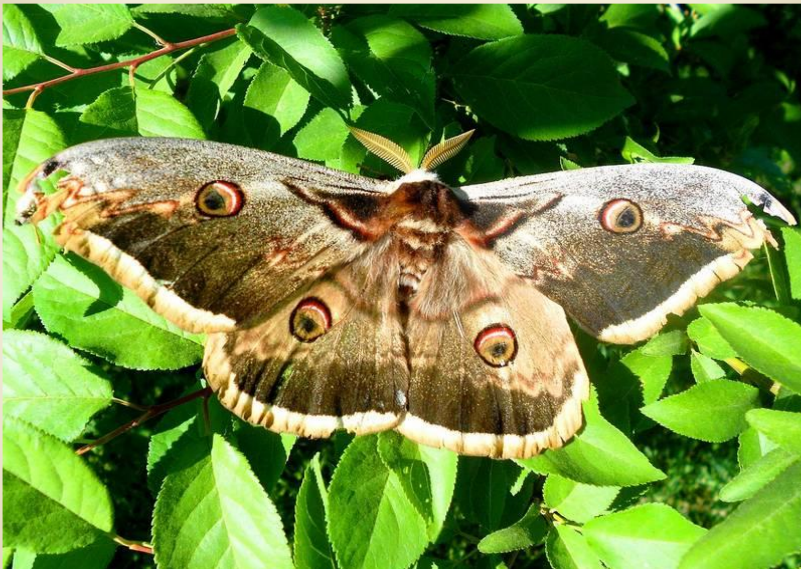
Павлиноглазка грушевая или сатурния грушевая