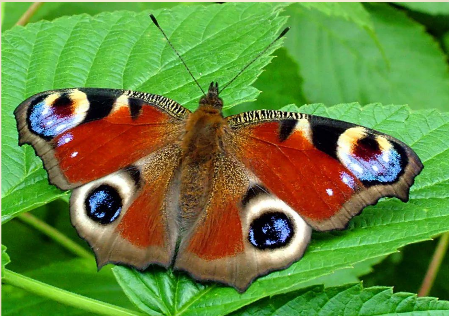
ДНЕВНОЙ ПАВЛИНИЙ ГЛАЗ