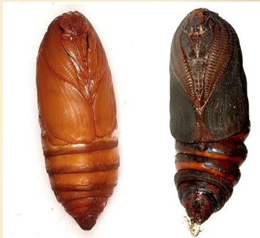
Куколки бабочки сатурнии