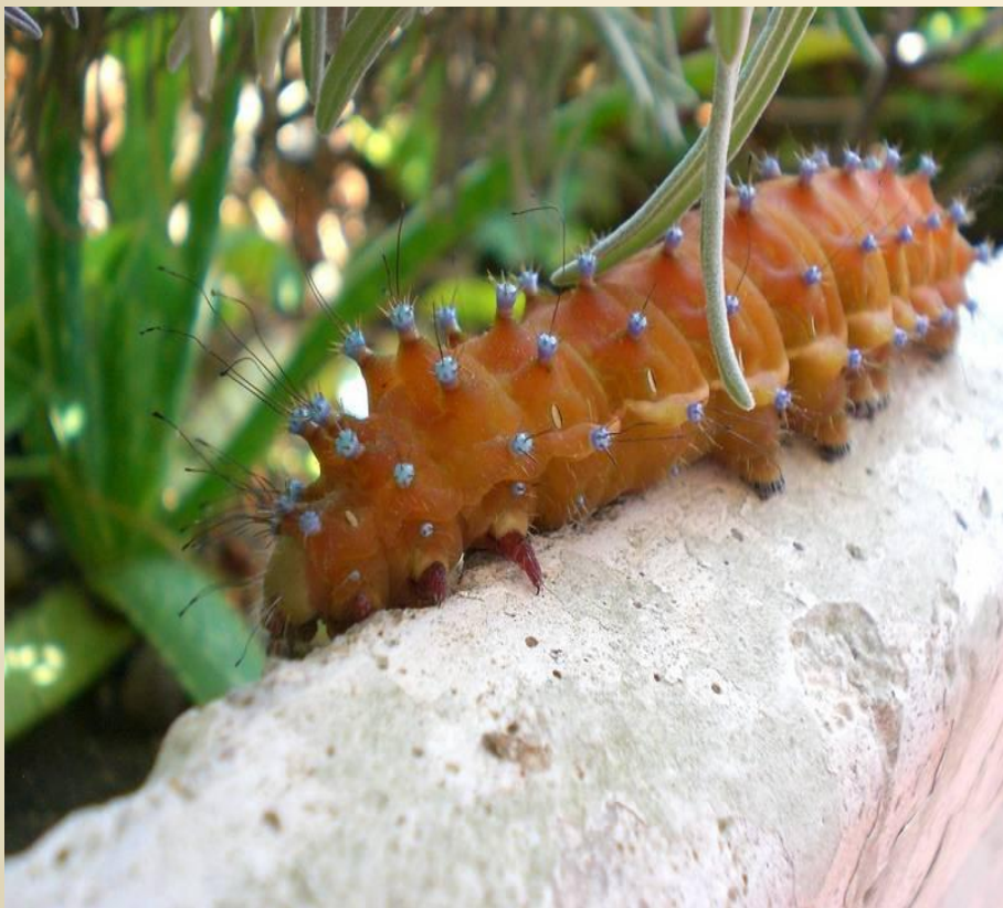
Окраска гусеницы бабочки сатурнии после последней линьки