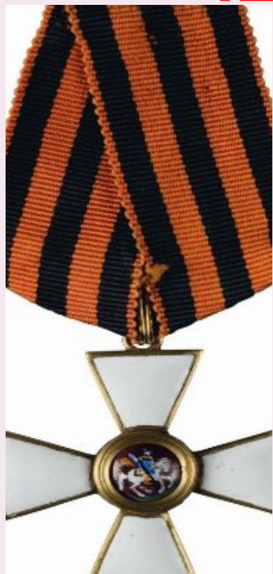
КАВАЛЕРОВ ОРДЕНА СВЯТОГО ГЕОРГИЯ