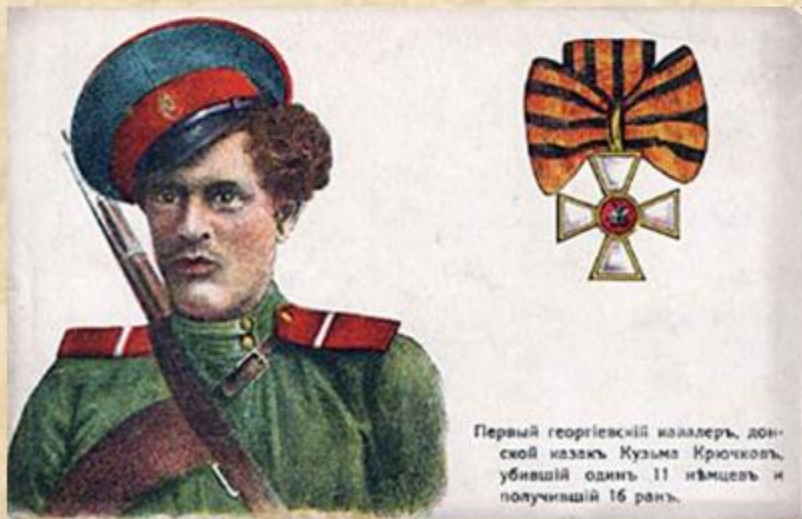
Первый георгиевский кавалер, донской казак Кузьма Крючков, убивший одиннадцать немцев и получивший 16 ран.

Первый Георгиевский кавалер среди низших чинов русской армии — донской казак Кузьма Крючков, убивший одиннадцать немцев и получивший 16 ран