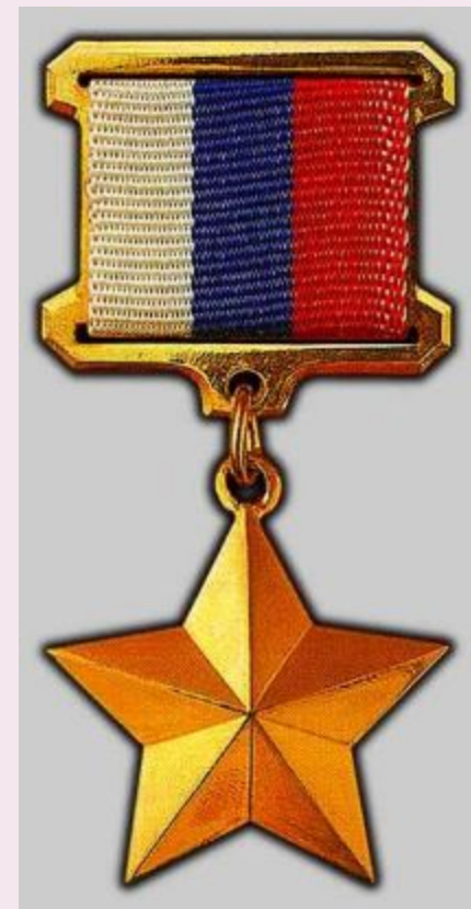
ГЕРОЕВ РОССИЙСКОЙ ФЕДЕРАЦИИ