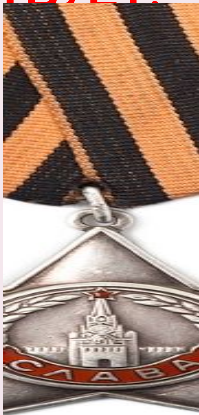
КАВАЛЕРОВ ОРДЕНА СЛАВЫ