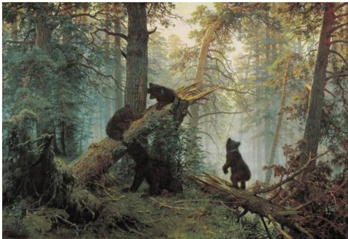
«Утро в сосновом бору» И. Шишкин