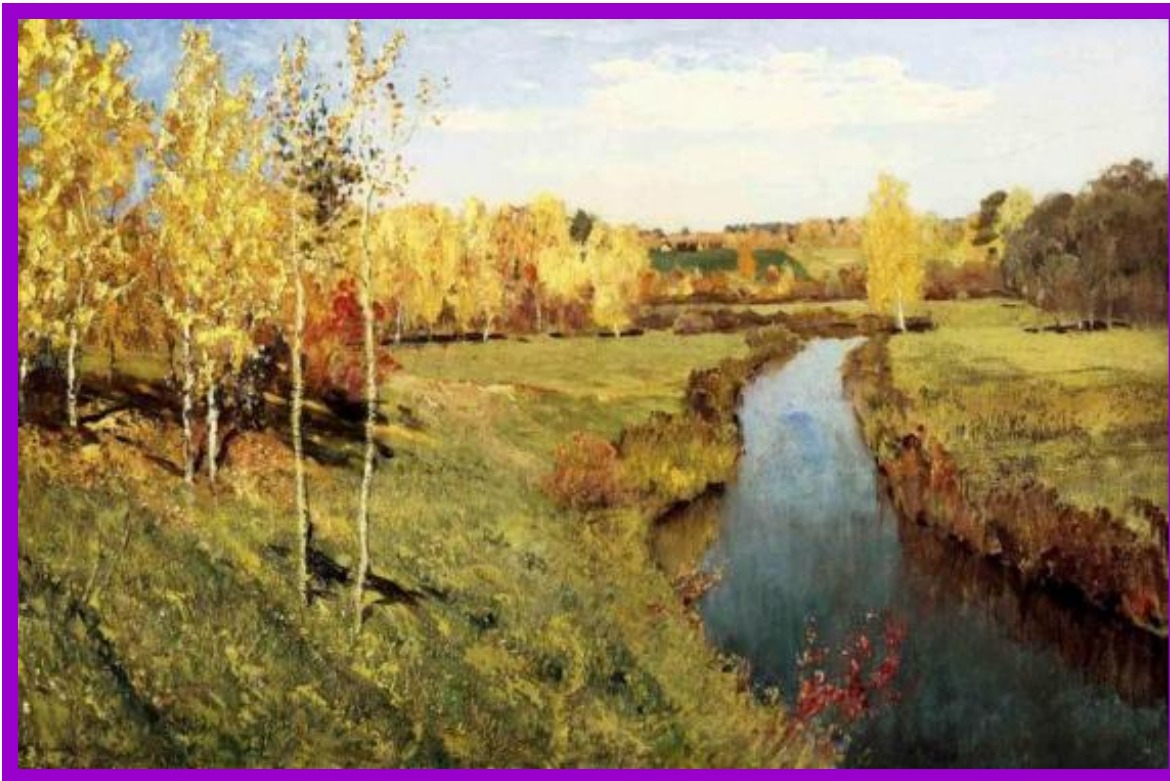
«Золотая осень» И .Левитан