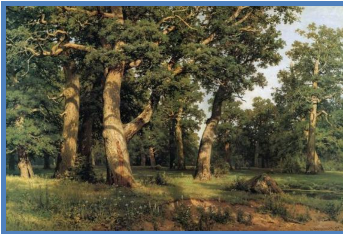
«Дубовая роща» И. Шишкин