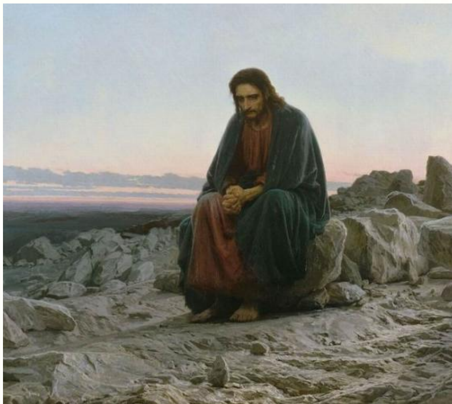
«Христос в пустыне» И. Крамской