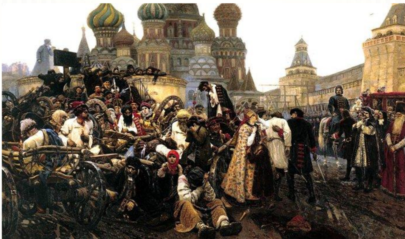
«Утро стрелецкой казни» В. Суриков