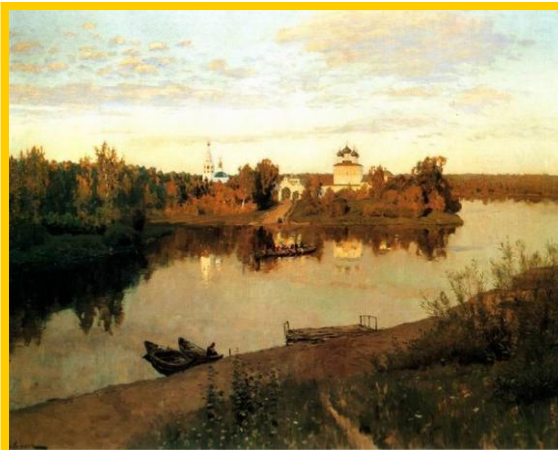
«Вечерний звон» И. Левитан