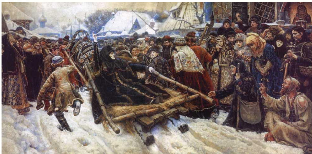
«Боярыня Морозова» В. Суриков