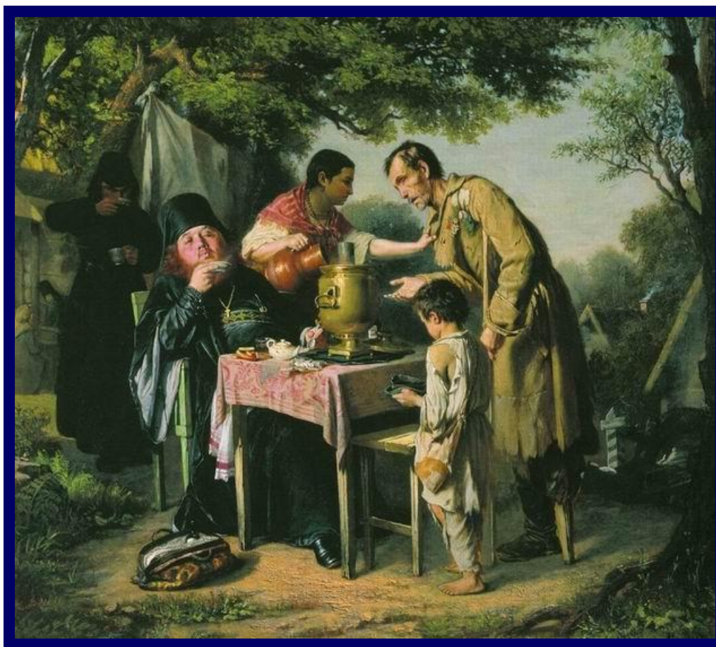
«Чаяпитие в Мытищах» В. Перов