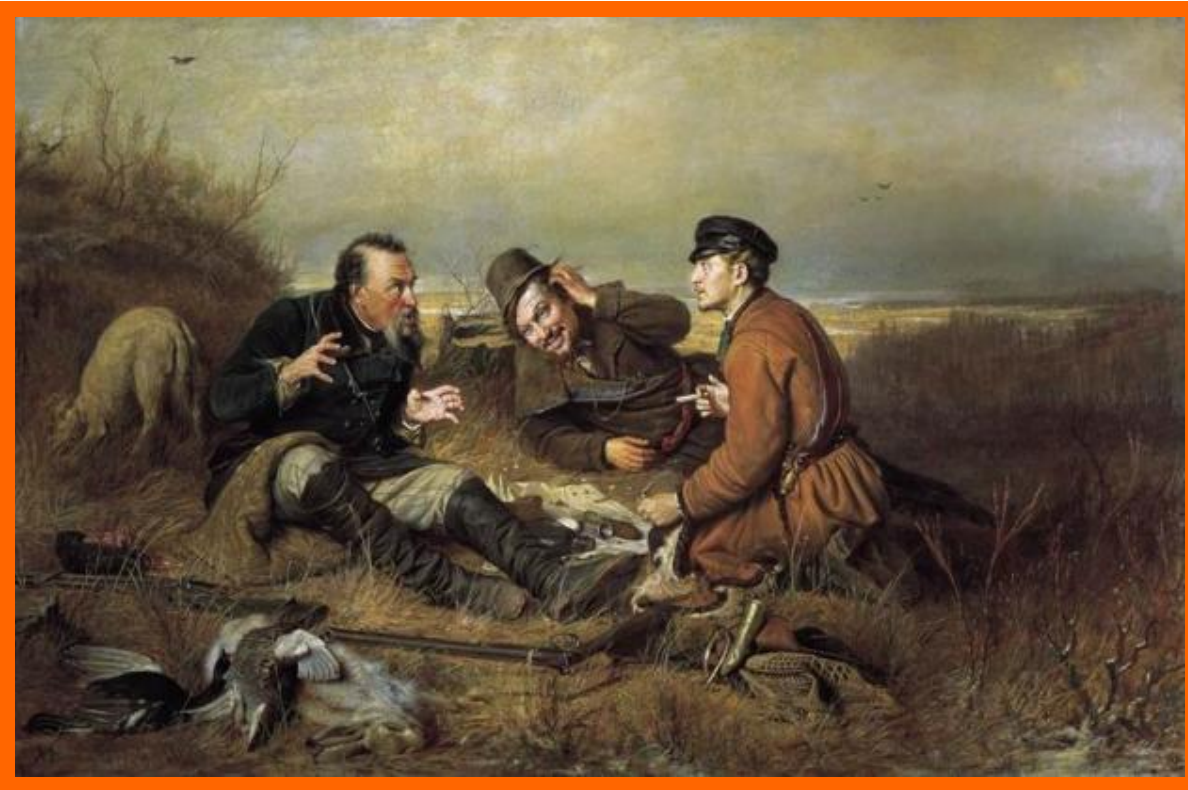
«Охотники на привале» В. Перов