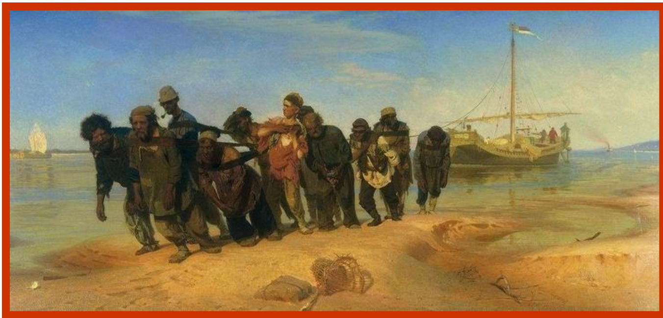
«Бурлаки на Волге» И. Репин