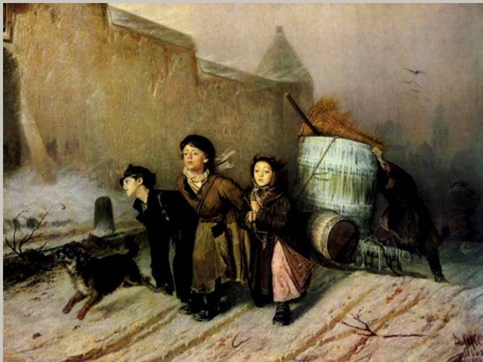
«Тройка» В. Перов