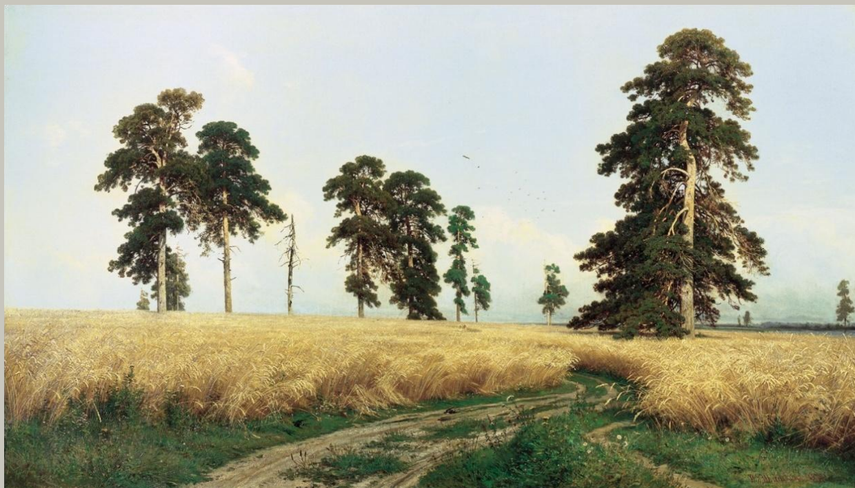
«Рожь» И. Шишкин