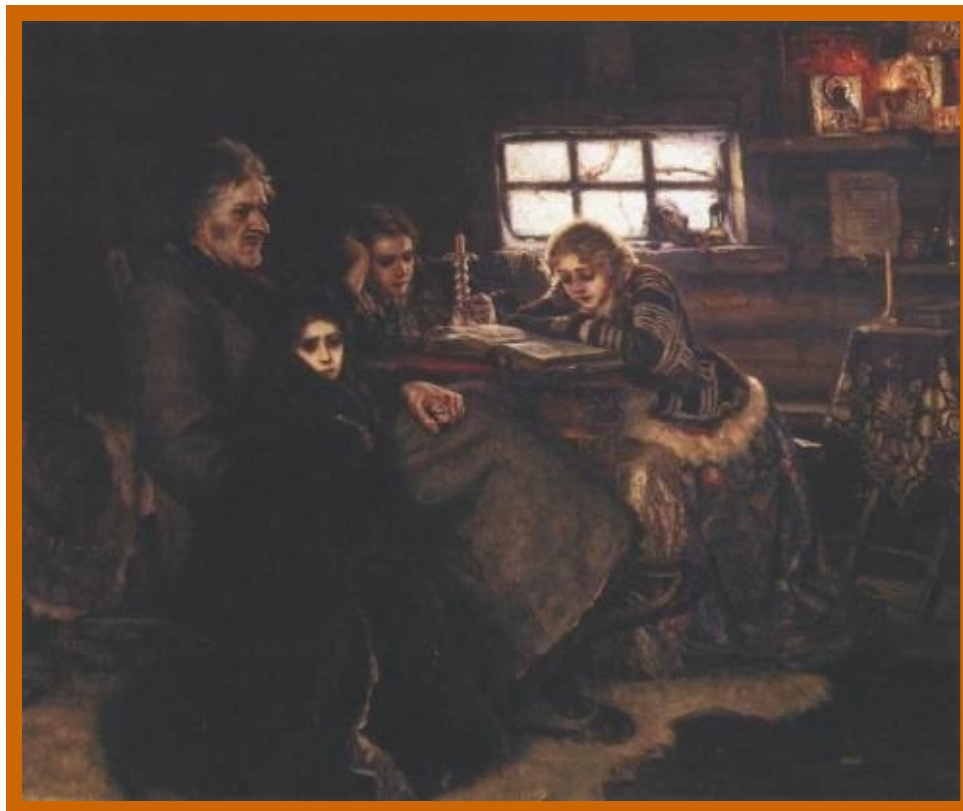
«Меншиков в Березове» В. Суриков