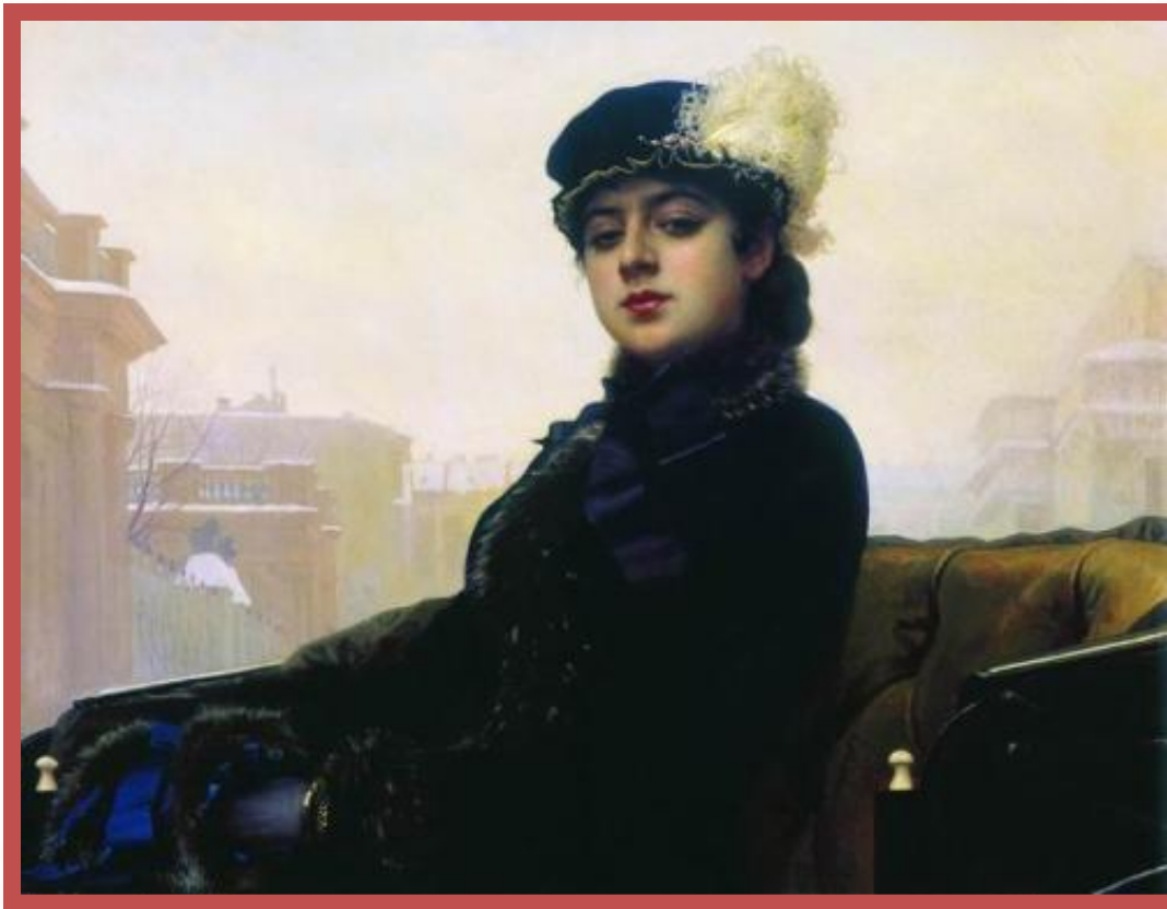
«Неизвестная» И. Крамской