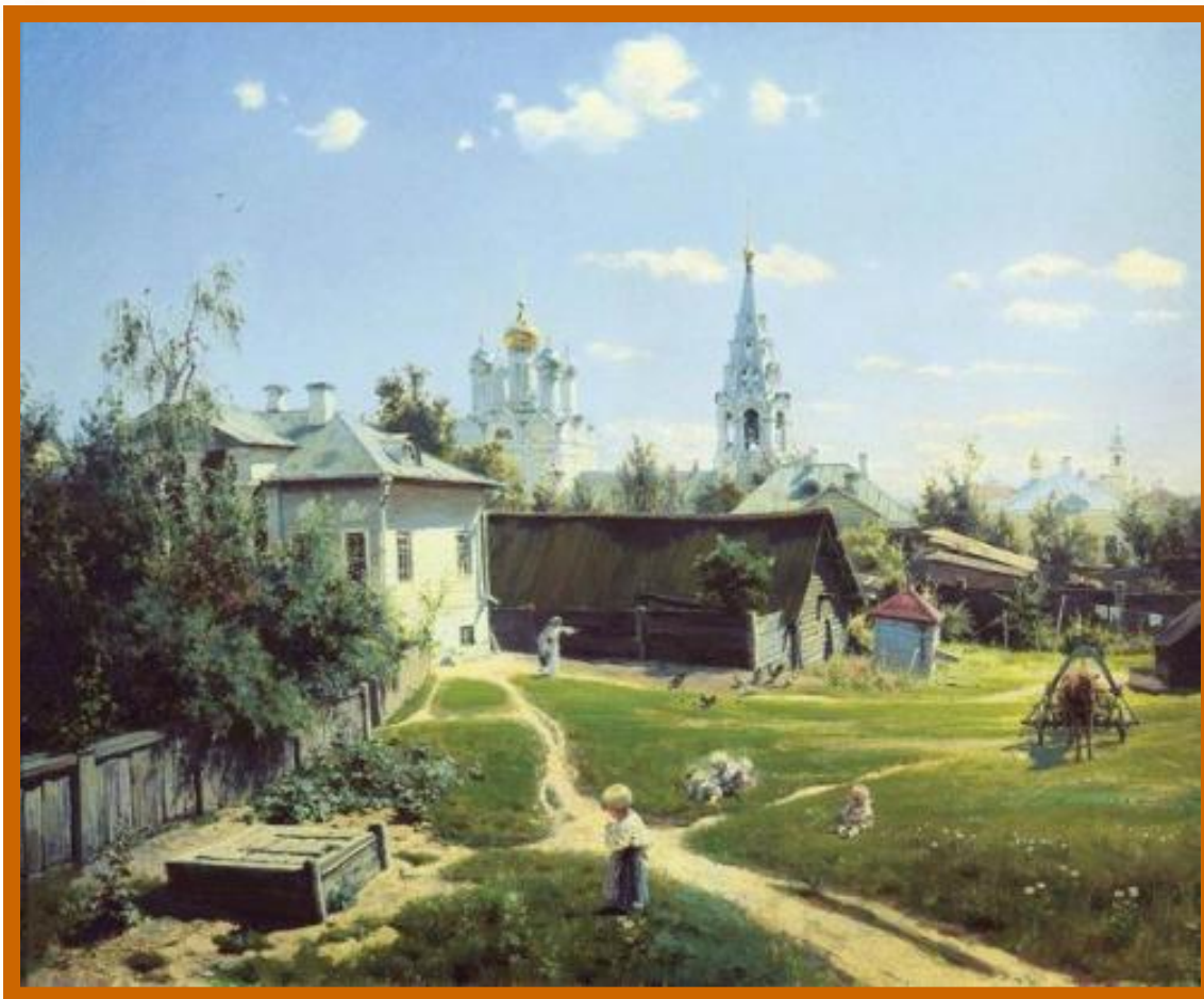
«Московский дворик» Поленов.