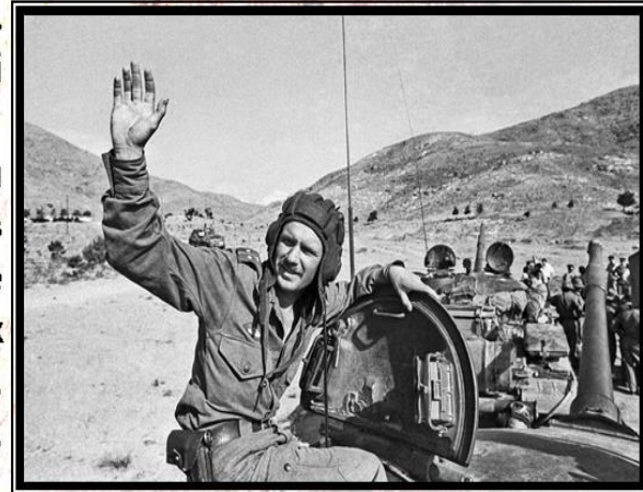
Кабул. Вывод советских воинских частей из Афганистана

Много горя, бед и страданий принесли нашему народу эти девять лет и пятьдесят один день жестоких сражений в чужом краю. Но и там, в далёком Афганистане, советские воины проявили лучшие человеческие качества: мужество, стойкость, благородство. В невероятно трудных условиях боевой жизни, вдали от дома, ежечасно подвергаясь опасности, и подчас смертельной, они сохранили верность военной присяге, воинскому и человеческому долгу.