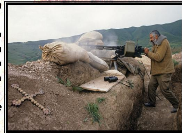
В зоне боевых действий в районе Гадрута, май 1992 года