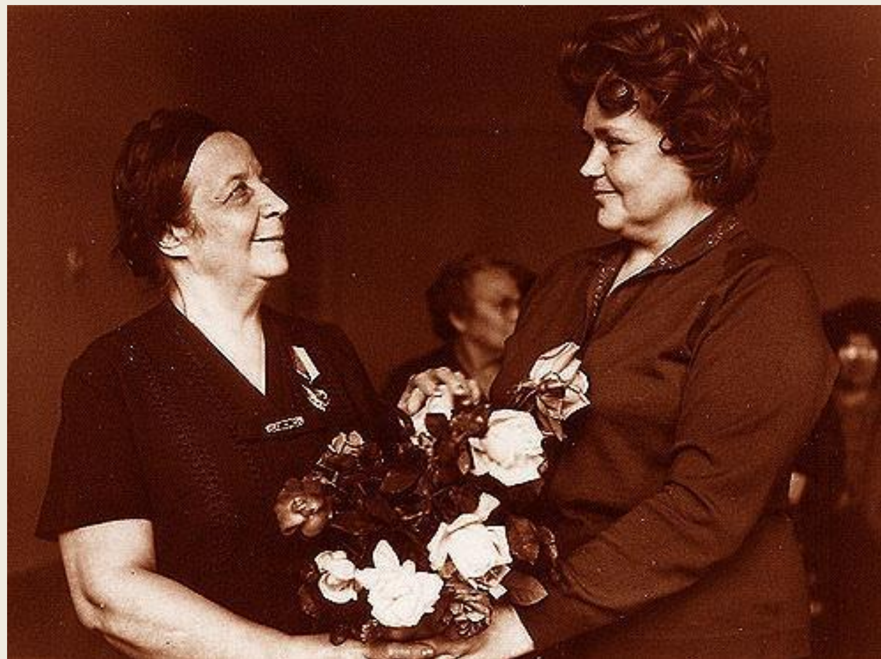
Умерла Ольга Скороходова в 1982 году

В 1948 году Скороходова стала научным сотрудником (позднее старшим научным сотрудником) НИИ дефектологии АПН СССР, где проработала до конца своей жизни.