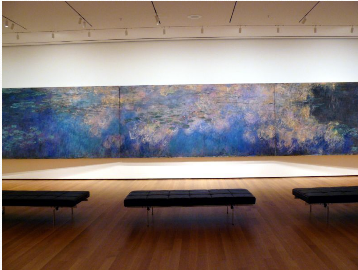
Отражение облаков в пруду с водяными лилиями, 1920, Нью-Йоркский музей современного искусства