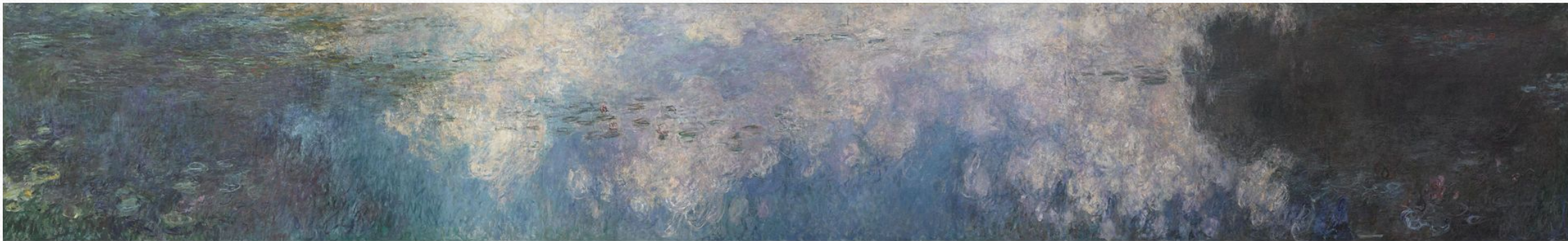
Кувшинки. Облака, 1920—1926, Музей Оранжери