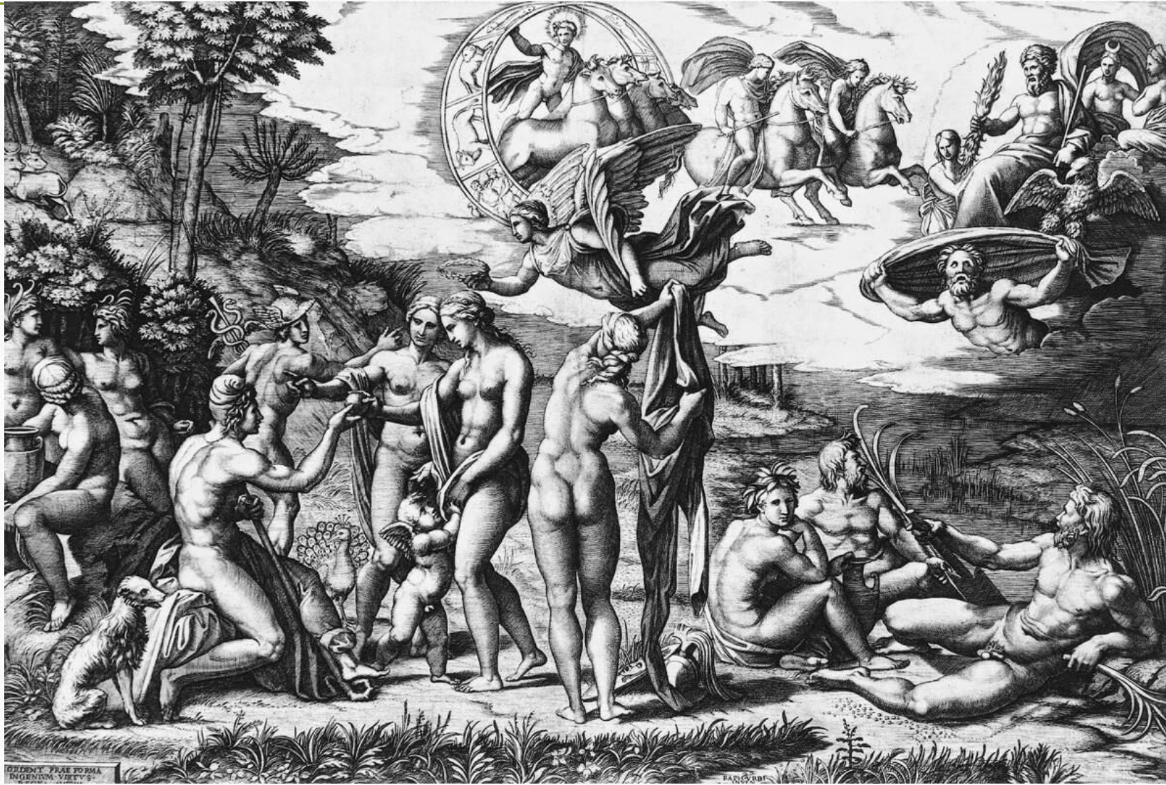
Маркантонио Раймонди «Суд Париса»