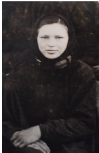
Бабушка до замужества