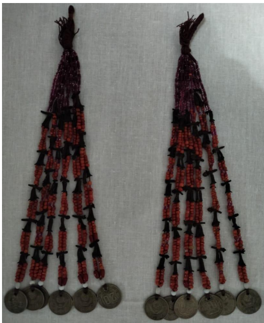
Длинные околоушные подвески сулпы .