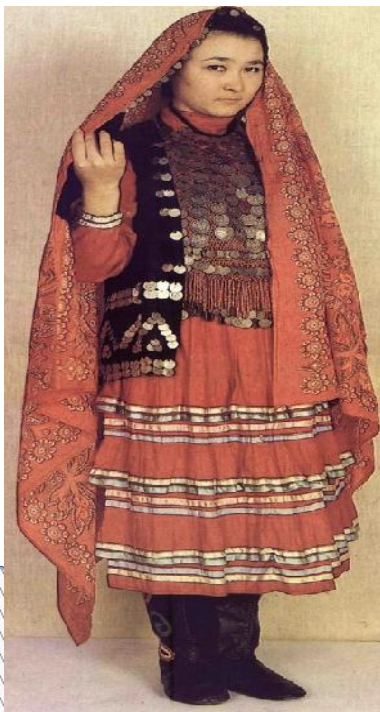
Башкирка в национальном костюме. Начало 20 века