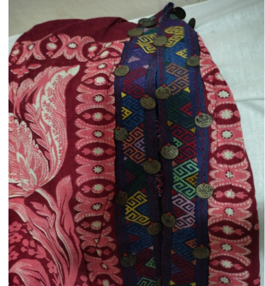
Вышитый орнамент по