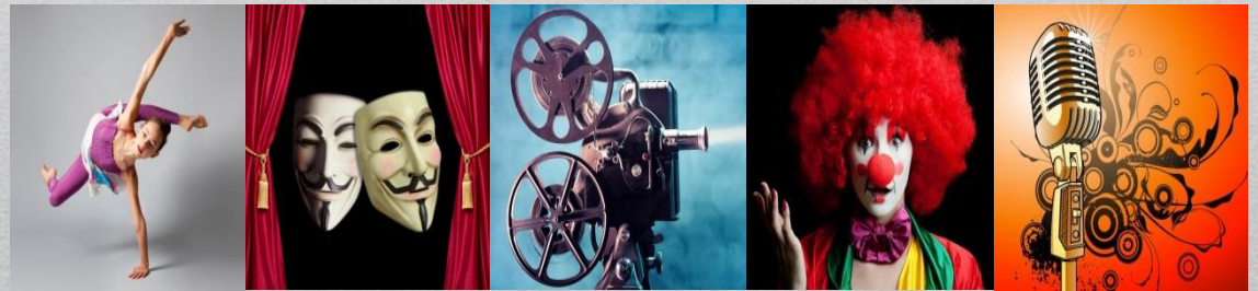
Пространственно-временное (синтетическое, зрелищное)