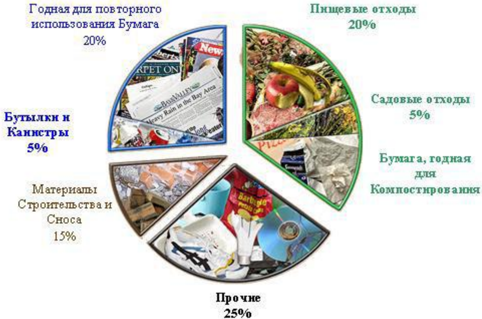
Рис. 4 Состав потоков отходов г. Сан-Франциско