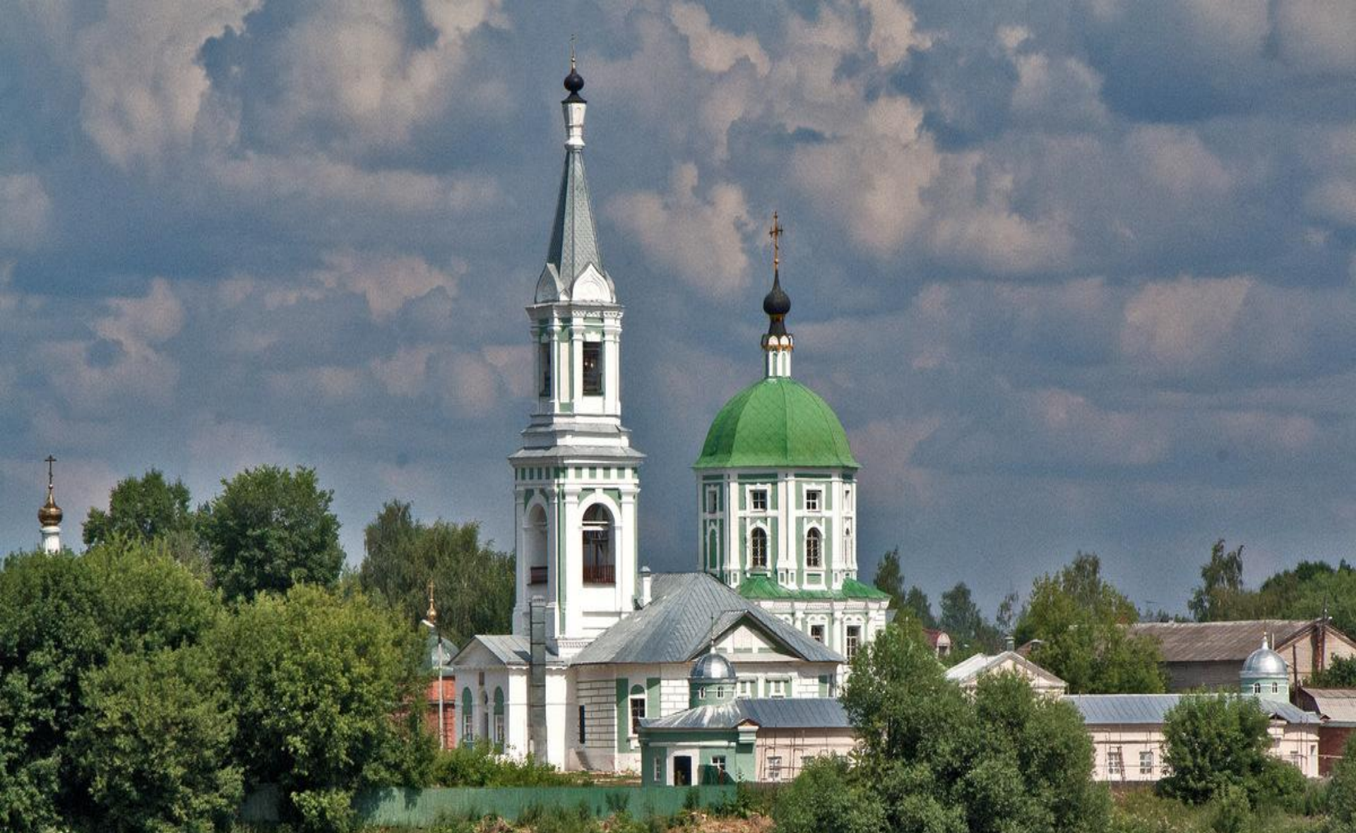
Свято-Екатерининский женский монастырь.