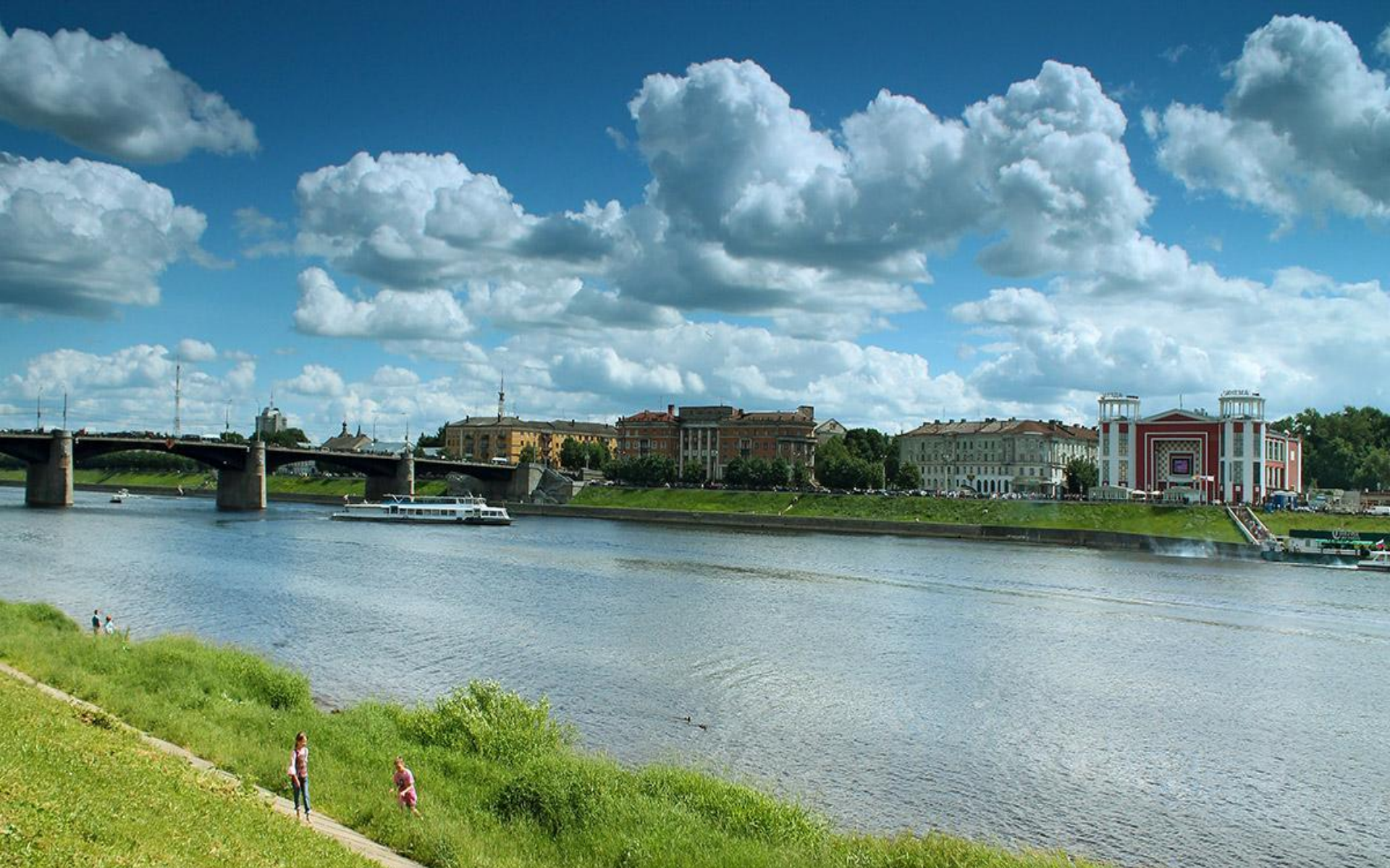
Набережная Степана Разина.