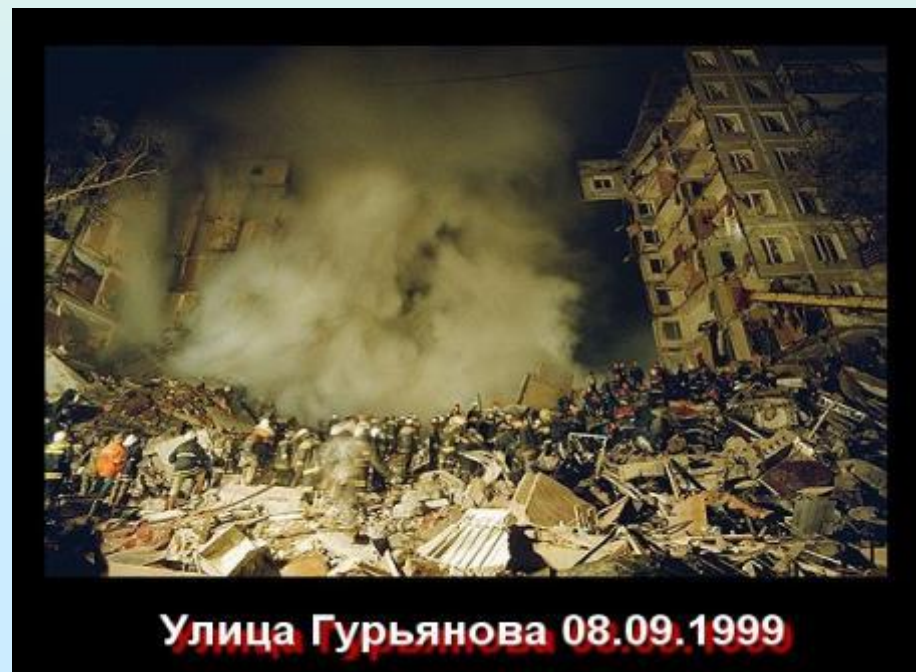
Улица Гурьянова 08.09.1999