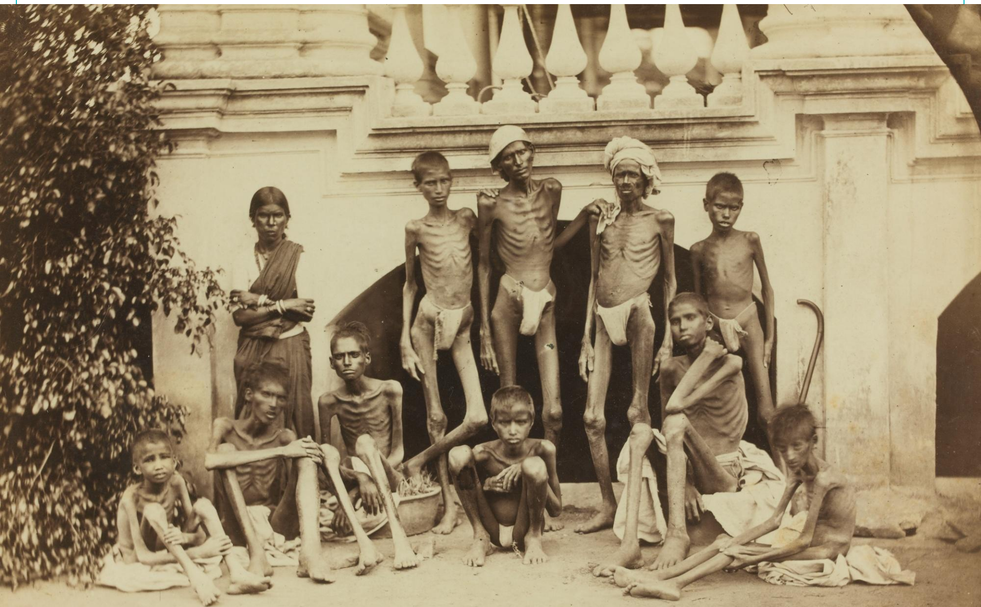
Голод в Бенгалии в 1943 году