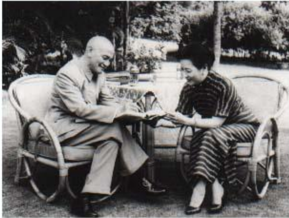
Чан Кайши со своей женой на Тайване в 1955 г.