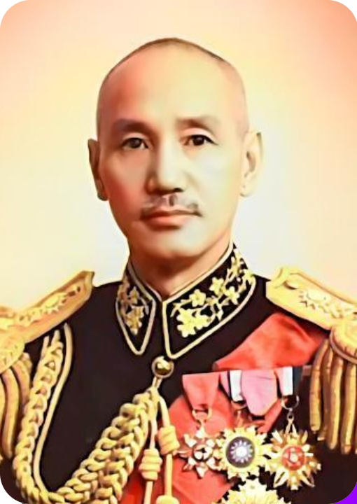
Чан Кайши, 1887-1975