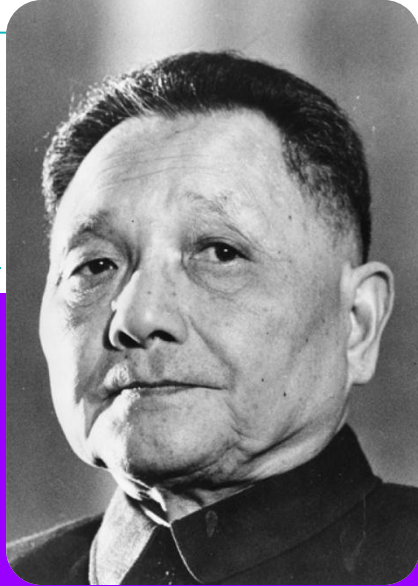
Ден Сяопин, 1904-1997