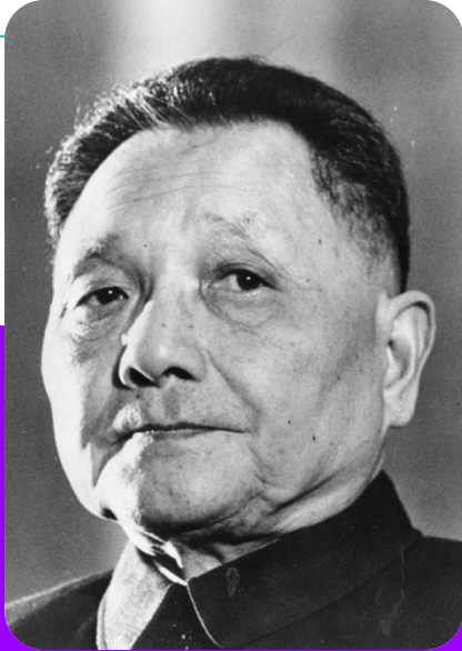
Ден Сяопин, 1904-1997