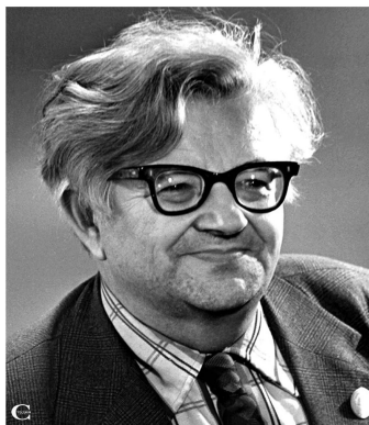
Берестов Валентин Дмитриевич (1928-1998) Экскурсия "Лауреаты IBBY"