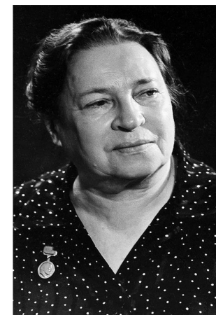
Агния Львовна Барто (1906-1981) Экскурсия "Лауреаты IBBY"