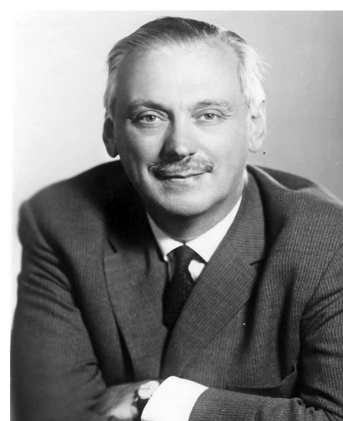
Сергей Владимирович Михалков (1913-2009) Экскурсия "Лауреаты IBBY"