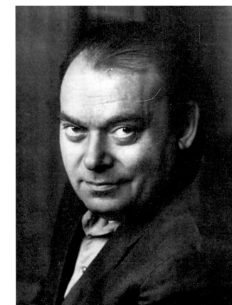
Борис Владимирович Заходер (1918-2000) Экскурсия "Лауреаты IBBY"