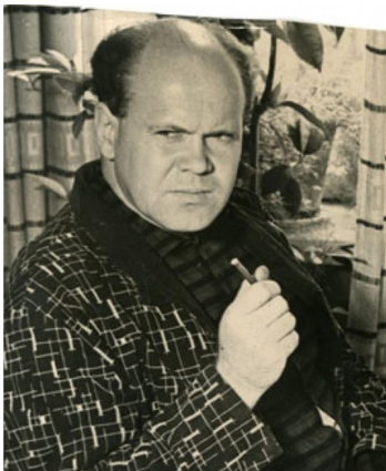
Лев Алексеевич Токмаков (1928-2010) Экскурсия "Лауреаты IBBY"