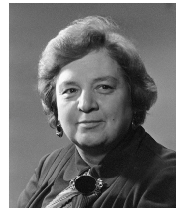
Ирина Петровна Токмакова (1929-2018) Экскурсия "Лауреаты IBBY"