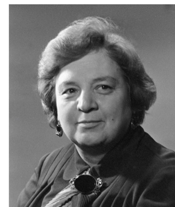
Ирина Петровна Токмакова (1929-2018) Экскурсия "Лауреаты IBBY"