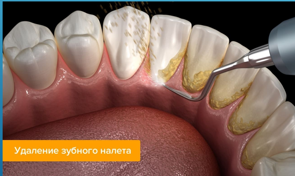
Удаление зубного налета

Проведение профессиональной гигиены полости рта (удаление мягких и твердых зубных отложений) Местная противомикробная и противовоспалительная терапия Динамическое наблюдение